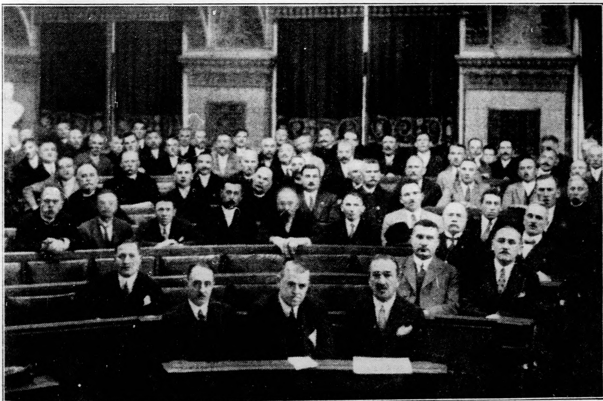
A „Falu” Országos Földművelésügyi közgyűlésén a hallgatóság egy része.

Ma, amikor Magyar Hetet rendezünk az országban, nagyon is időszerű, hogy azokról beszéljünk,