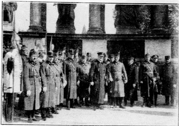
A Mária Terézia Rend tagjai Mária Terézia szobránál.