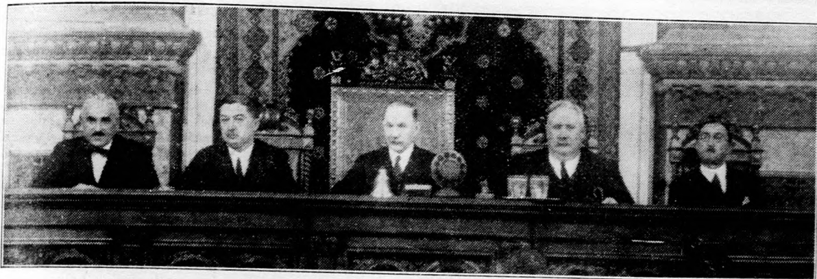
A „Falu“ Országos Földművelésügyi közgyűlésének elnöki emelvénye.