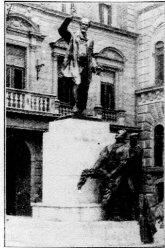
Zichy Nándor gróf szobra Budapesten