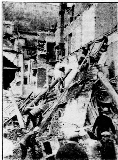
Kép a lyoni földomlás okozta katasztrófáról.

Nem tudta eladni a burgonyát, szétosztotta a szegények között. Egy soroksári gazdálkodó november hó 19-én tíz mázsás burgonyát vitt be a budapesti piacra, ahol azonban nem ígérték megfelelő árat a burgonyáért. A gazdálkodó annyira megboszorkodott a túlságosan alacsony árajánlatok miatt, hogy visszafordult kocsijárával és a burgonyát a soroksári határban lévő nyomortelep lakói között ingyen szétosztotta.