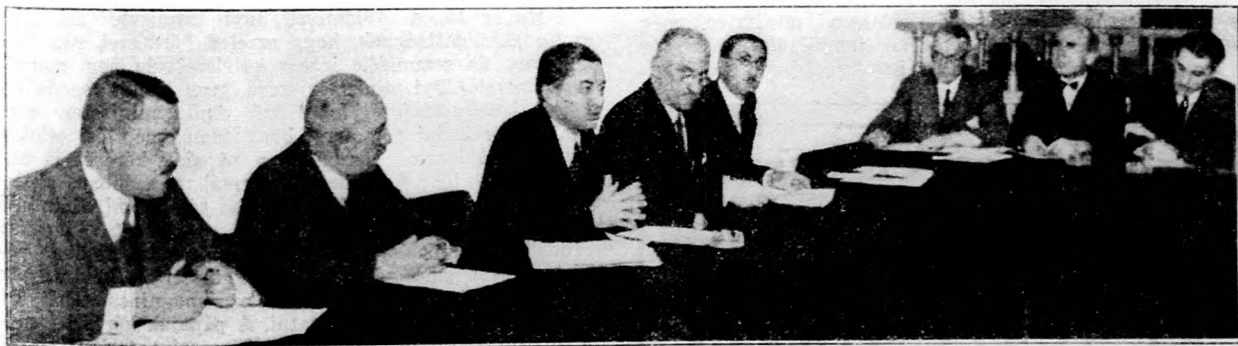
Kép a „Falu” Országos Földművelésügyi Szövetség választmányi üléséről.