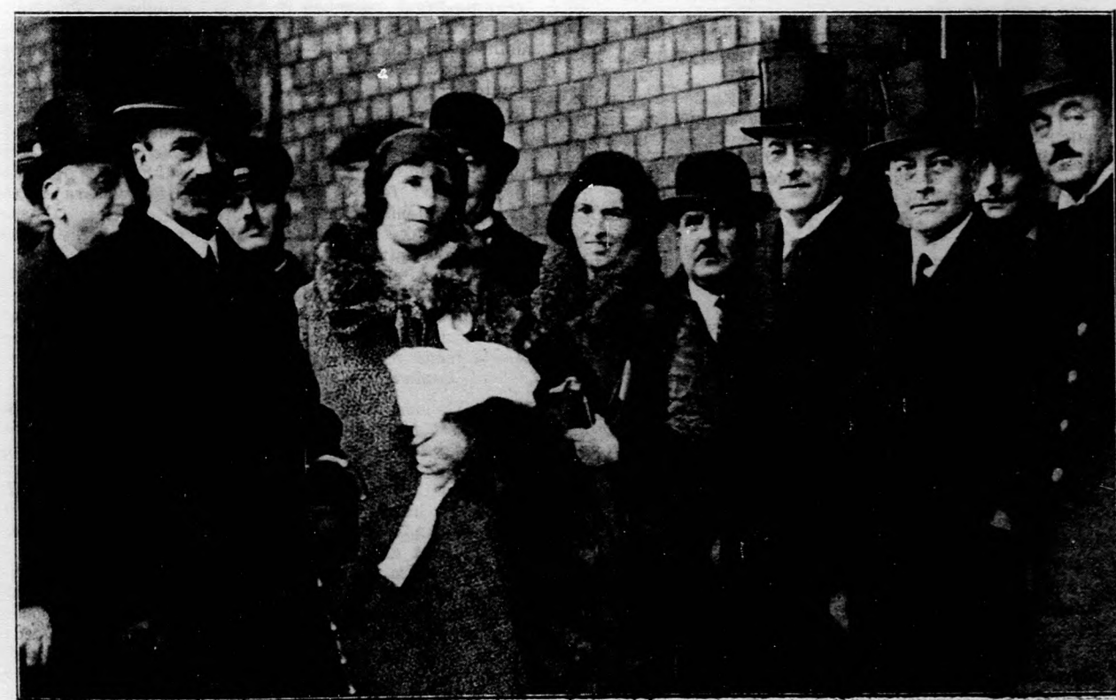
Bethlen István gróf fogadtatása a berlini anhalti pályaudvaron.

A falu e nagy bajában a Vasárnap volt az első, amely felhívta az illetékes kormánykörök figyelmét arra a tartahatatlanságotra, amely egyes vidékek kisgazdáit lassan a koldusbotra juttatja. De foglalkozott a vadkárokkal a Faluszövetség választmánya is. Az igazgató-választmány