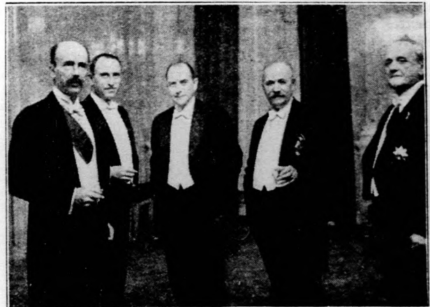
Bethlen István gróf a berlini Collegium Hungaricum estélyén.

A miniszterelnök kijelentette még, hogy Bécsben is szándékozik látogatást tenni és viszonzni azt a látogatást, amit Schober kancellár tett annakidején a magyar fővárosban. Bécsi utjának időpontját azonban nem tudja megmondani, mert ez elsősorban az osztrák belpolitikai viszonyok fejlődésétől függ.