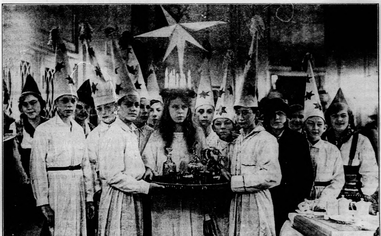
Szilveszteri ünnepség Svédországban.

Sok, igen sok jel mutatja, hogy így lesz. Utóvégre