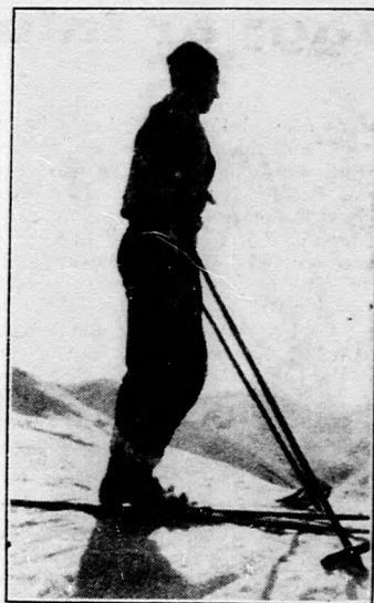
Megkezdődött a sí-szezon.

Másodszorban arra fordítsuk figyelmünket, hogy a köldökcsonkon keresztül fertőző baktériumok az ujszülött szervezetébe ne jussanak. Ennek veszélye igen nagy. Hiszen az almon, az istálló berendezési tárgyain, az ápolók kezein milliószámra tenyésznek a bacillusok, melyek geny és evvöröség, vérhas, stb. betegségek tünetei közt könnyen elpusztíthatják a gyenge borjut. A fertőzés kapuja legtöbbször a be nem száradt köldökcsonk. Ezért a leg- radikálisabb óvintézkedés lenne a köldökcsonknak vékony, baktériummentes fonállal való lektése. Minthogy azonban a szülésnél jelenlevő egyén kezei sohasem teljesen tiszták, jobb, ha a lektéstől eltekintünk és inkább a négy lábra állított borju köldökcsonkját 1—2 percig szélesnyaku, jódtinktúrát tartalmazó üvegen fűrésztjük és az-