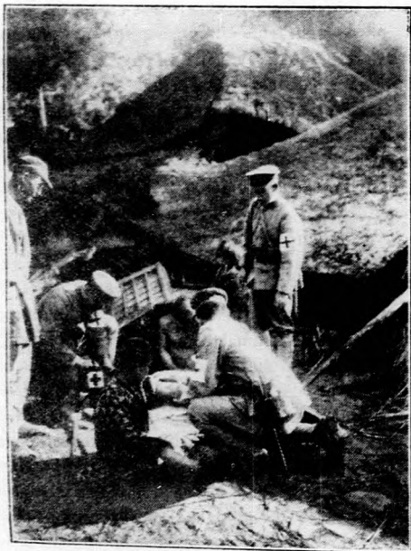
Kép a legutóbbi japán földrengésről.