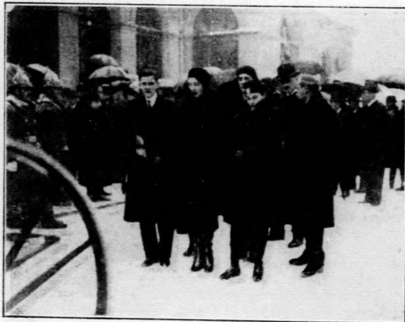
A gyászoló család tagjai Szabóky Alajos államtitkár temetésén.

A fentiekből megállapítható, hogy Szeged város levonta az eddig fennálló áldatlan állapotok tanuságait és kész olyan áldozatokra, amelyek nehéz pénzügyi viszonyait tekintve, igazán elismerésre méltóak. Úgy tudjuk, hogy a városnak igen messzemenő terveik vannak, amelyek merőben másképen alakítanák ki az egész szegedi kisbérleti rendszer képét. Egyelőre fokozottabb mértékben kíván a kisbérlok gazdálkodásának megjavításával foglalkozni és a Várostanján és Csengelén működő okleveles városi gazdák kötelességévé tette, hogy a bérlőket gazdálkodásukban támogassák. Ezen a téren nagy szerep vár a Szegedi Földbérlok Szövetkezetére is, amely a homoktalajok megjavítása, jövedelmezőbb termelési ágak bevezetése és meghonosítása, a bérlők gazdasági műveltségének emelése és az értékesítés megszervezése körül kell, hogy tevékenységét kiéjtse. Az elsők között kell azonban a bérlők kedvező feltételű forgótőke szükségletéről gondoskodni, mert a bérlők az anyagi leromlás mai állapotában a jövedelmezőbb gazdálkodáshoz hozzá sem kezdhetnek.