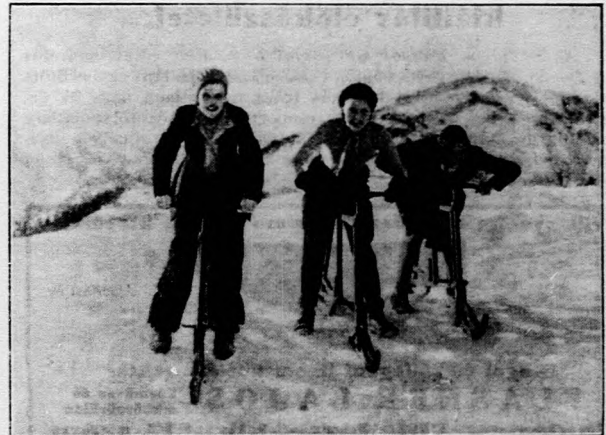
Uj téli sporteszközök.

Ebből tehát azt látjuk, hogy az illetékesek csendben dolgoznak, de dolgoznak . A mai időkben ez a rendelet is azt mutatja, hogy amikor megteheti a kormány, hatéko-