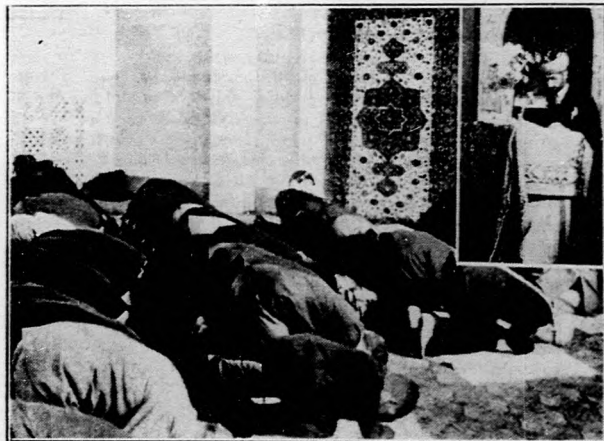
Török templomi ájtatosság.