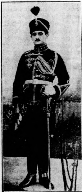
Zogu, albán király.