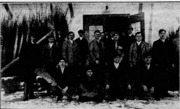
A jászberényi m. kir. mezőgazdasági szakiskolában rendezett teli gazdasági és háziipari tanfolyam hallgatói.