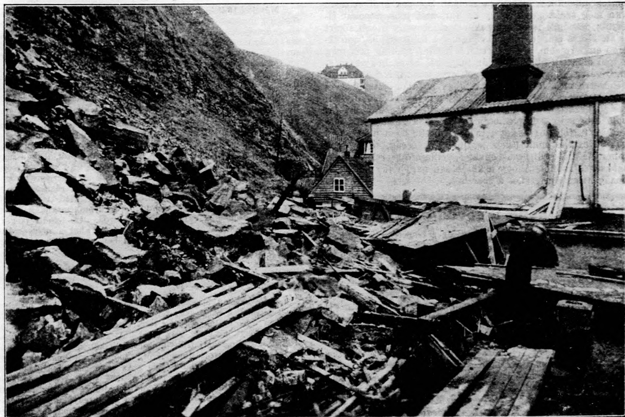
Földrengés Délszerbiában, több mint száz halottal. Képünk egy összeomlott téglagyárat ábrázol.

A derengésnek, a gazdasági élet jobbrafordulásának azonban, sok más egyéb előjelei is vannak. Európa nagyhatalmainak a tengeri leszerelésben való megegyezése, Angliának Ghandival s az indiaiakkal való kibékülése rendkívüli jó hatással lesz Európa gazdasági életének további fejlődésére. A háborús fegyverkezésre fordított pénz igen jelentékeny része fel fog szabadulni és a békés gazdasági munka, a mezőgazdaság, ipar és kereskedelem fejlesztésére fog szolgálni. Szükséges azonban, hogy Európa hatalmasainak a megegyezése őszinte legyen és a megegyezés mielőbb testet is öltjön, mert hiszen nemcsak a kicsire