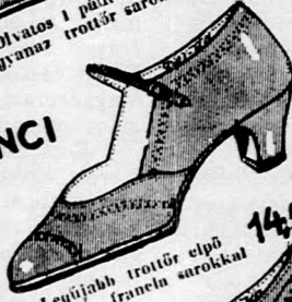
Legújabb trotör cipő Ugyanaz, francia sarokkal 14,50