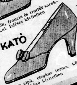
Kívágott cipő, elegáns torna. kö-lőnböző kivitelben 19,50