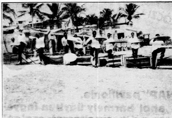
Néger pincérek tréfás versenye Amerikában.

Ezután Orffy Imre a borfogyasztási adó kérdését tette szóvá. Utalt arra, hogy a mezőgazdasági termelés kérdésében igen sok téren van már és készül olyan intézkedés, mely azt az érzést kelti az egész országban, hogy ezek a kérdések jó vágányba jutnak. Meg van győződve arról, hogy a bortermelés terén is van programja a kormánynak, a borfogyasztási adó kérdése azonban annyira időszerű, hogy sürgős intézkedést tesz szükségessé. Kéri a kormányt, minél előbb tegye lehetővé a borfogyasztási adó leszállítását.