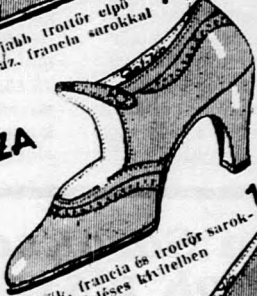
Dívaticipők, francia és trotör sarokkal. Ezlétes kivitelben 16,50