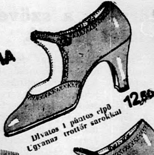
Dívtos 1 pántos cipő Ugyanaz trotör sarokkal 12,50