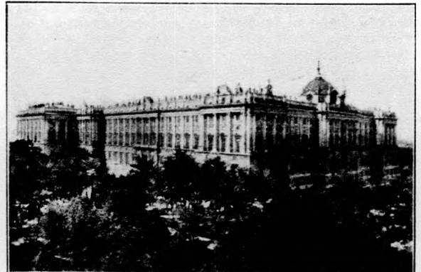
A madridi királyi palota, amelyet a spanyol király és családja elhagyott.

Vidéki városokban különböző híradások jelentek meg, amelyekben a földteherrendezési eljárásra közvetítést ajánlanak fel. E hirdetésekkel kapcsolatban illetékes helyről arra figyelmeztetik az érdekelteket, hogy a legközelebb meginduló földteherrendezésnél közvetítőkre semmiféle szükség nincs és az ilyenek igénybevétele az érdekelteknek csak felesleges kiadásokat okozhat. Azok a gazdák, akik a földteherrendezésbe bekapcsolódni óhajtanak, közvetítőt ne vegyenek igénybe, mert azoknak ügyét a Földteherrendező Országos Bizottság (ötös bizottság) minden közvetítés nélkül fogja intézni.