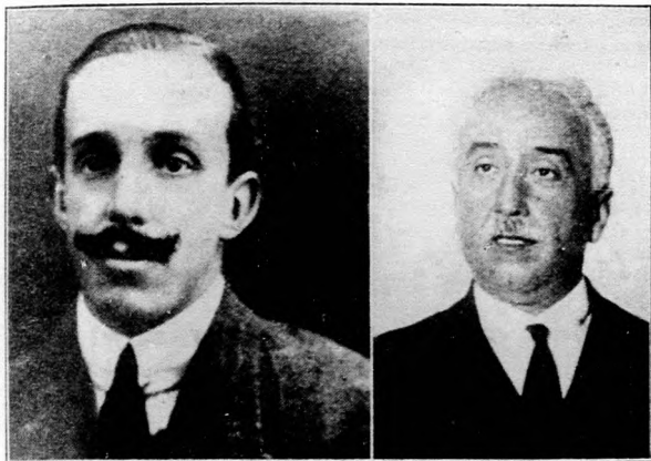
A spanyol forradalom két főalakja.

Alig mult tiz napja, hogy Spanyolország fővárosában, Madridban, sokak előtt teljesen váratlan események zajlottak le gyors egymásutánban. A rádió a világ minden tájára szertevitte a spanyol forradalom hírbüzeit: XIII. Alfonz király átadta a hatalmat és elhagyta országát... A szocialista munkáspárt kikiáltotta a Spanyol-köztársaságot... és így tovább... És a híradások özöne egyszerre az egész emberiség érdeklődésének középpontjába helyezte az Ibériai-félsziget egykor hatalmas és duszadag nemzetét.