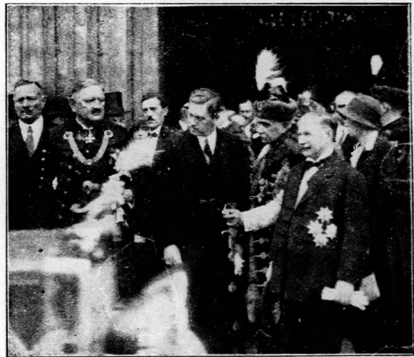
Mayer János földművelésügyi miniszter, az országgyűlés ünnepélyes megnyitása alkalmából, a Mátyás-templomban tartott szentmise után, a templom előtt.

— Elsősorban mezőgazdasággal foglalkozó nemzet vagyunk. A kormány minden igyekezete tehát oda irányul, hogy egyrészt mezőgazdasági feleslegeinknek piacot biztosítson, másrészt, a termelő számára jobb árakat érjen el. E célok megvalósítása érdekében új kereskedelmi szerződések kötésére törekszünk. Mezőgazdasági termelésünk fejlesztésének belső munkatervét a világ gazdasági válság leküzdésének nemzetközi vonatkozásai fogják irányítani. Ugy a növénytermelés, mint az állattenyésztés terén a minőségi termelés megszervezése a legégetőbb feladat. Szélsőséges éghajlati viszonyaink az öntözés ügyének célirányos és fokozatos felkarolásával vizeink hasznosítását, továbbá az erdősítésnek és fásításnak tervszerű továbbfejlesztését igen fontos feladatunkká teszik.