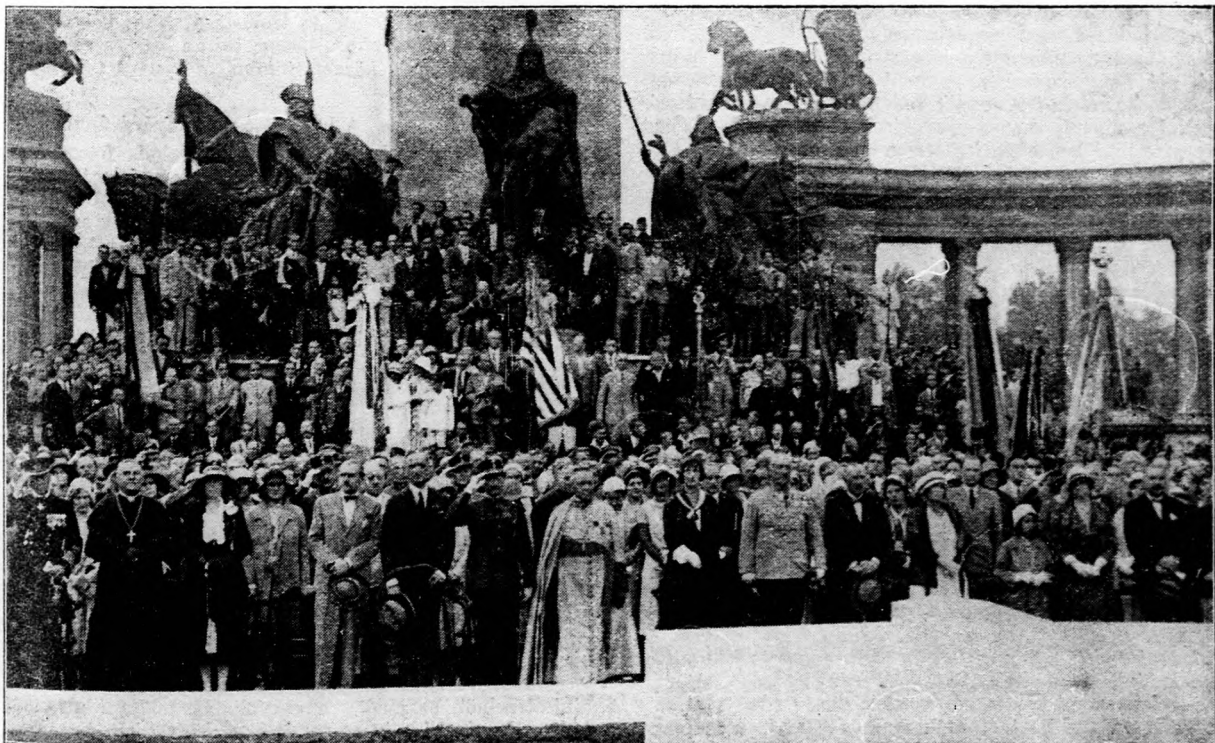
Az óceánrepülők ünneplésére összegyűlt közönség a Hősök Emlékkövénél a Himnuszot hallgatja.

tennie, hogy a deficit onnan eltüntettessék. Én ezzel eleget mondtam és azt hiszem, bizonyítottam azt, hogy olyan rendkívüli körülmények között élünk, él az egész világ, amely rendkívüli körülményekkel szemben, különösen egy olyan nehéz helyzetben levő országban, amely a trianoni szerződésen ment keresztül, devalváción, szanálási perióduson, amely kénytelen volt igénybe venni nagy mértékben az állampolgárok áldozatkészségét: ilyen országban, ilyen világgazdasági krízissel megküzdzeni nem olyan könnyű és nem olyan egyszerű feladat.