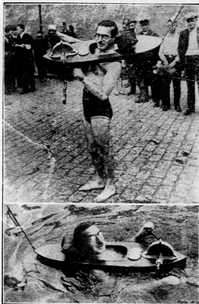
A világ legkisebb csónakja.

Aranyérnél és az evvel járó béldugulás, repedés, kelés, gyakori vizelési inger, derékfájás, mellszorulás, szivdobogás és sédülési rohamoknál a természetes „Ferenc József” keserűviz használata kellemes megkönnyebbülést eredményez. A belső bajok orvosai az igen enyhe hatású Ferenc József vizet sokszor mindennapi használatra reggel és este egy-egy fél pohárrnyi mennyiségben rendelik. A Ferenc József keserűviz gyógyserfárakban, drogériákban és fűszerüzletekben kapható.