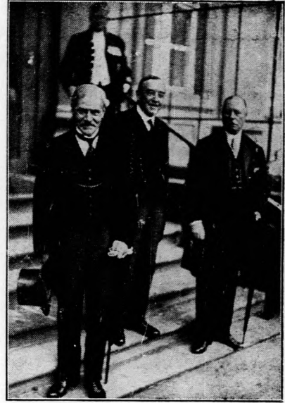
Angol államférfiak Berlinben.

Az igazságügyminiszter szavait általános helyeslés és éljenzés kísérte az Egységspárt sorain.