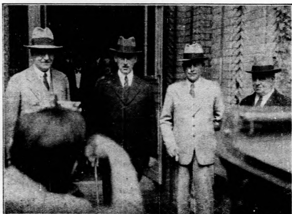
Amerika külügyminisztere Berlinben.

— A fegyelmi bíróságok tudták eddig és tudni fogják ezentul is kötelességüket. Arra kérem minden egyes képviselőtársamat és arra kérek minden panaszos felet, ha olyan panasza van, hogy valahol költségszaporítással akarják súlyosbitani a megpróbált magyar embereket helyzetét, méltóztassék hozzáam fordulni konkrét adatokkal. Meg vagyok győződve, hogy az autonóm ügyvédi bíróság megteszi a maga kötelességét, de el vagyok tökévelve arra is, hogy az ügyvédi rendtartás 100. szakasza alapján a királyi ügyészt fogom utasítani, ha bárhol azt