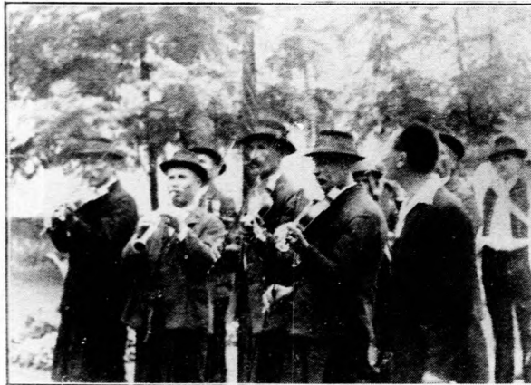
A cserépváraljai földmivész-zenekar a Szent István-napi ünnepeken.

A földművelésügyi minisztérium a jászberényi, karcaji, somogyzentlőrci (u. p. Kadarkut), pápai, békéscsabai és eszterláki, csermajori (u. p. Vitnyéd, Sopron vm.) és nagykállói m. kir. gazdasági szakiskolákban legelőtési társulati elnökök, gazdák, pénztárosok és előjárósági tagok, községi legelőgazdák, végül közös legelőkön érdekelt birtokosok elnökök részére a folyó évi november 15. és december 15. közötti időben, esetleg az 1932. évi február hóban 10 napon át rét- és legelőgazdasági alsófokú tanfolyamokat tartását vette terbe. A tanfolyam ingyenes és a résztvevők részére a tanfolyam alatti az intézetben díjtalan szállás és ellátás biztosított. Az oda- és visszautazás költségei fejében III. osztályú személyvonati jegy ára meg-