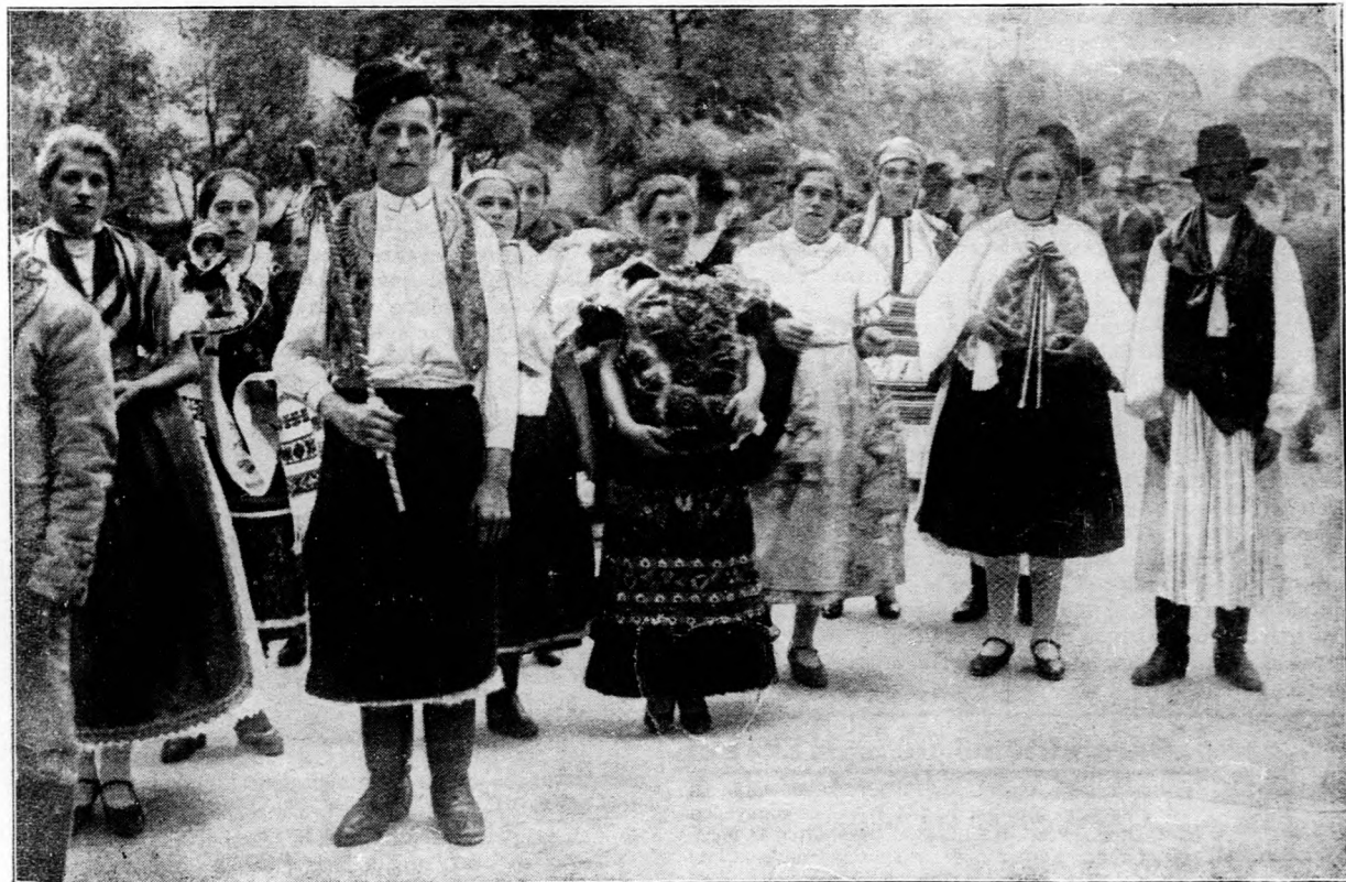
Szeged-vidéki földművelők a Szent István-napi körmeneten.

Aki vissza tud emlékezni Károlyi Sándor gróf korára,