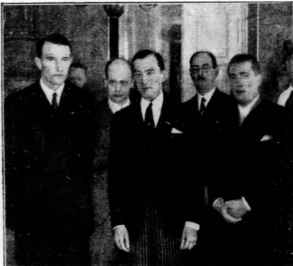
Jimmy Walker, Newyork polgármestere.

A cukorrépából összesen 8,571.600 mm termést várnak. A múlt évben összesen 14,610.201 mm cukorrépa termett.