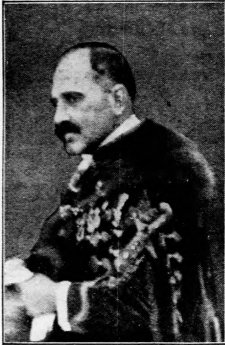
Ivády Béla, az új földművelésügyi miniszter.