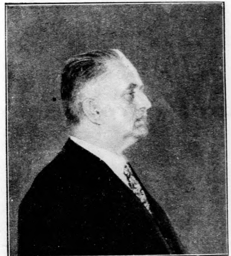
Kenéz Béla, az új kereskedelmi miniszter.

Augusztus hó 26-án Károlyi Gyula gróf miniszterelnök és kormánya a kormánytámogató Keresztény Gazdasági és Szociál-