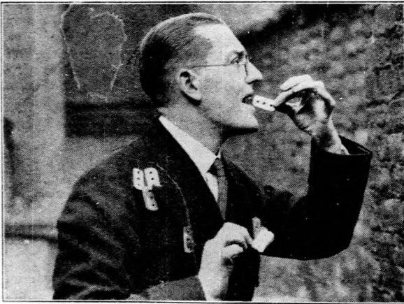
Aki borotvapengéssel tömi tele a száját.