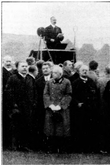
Zsitvay Tibor igazságügyminiszter gyászbeszédet mond a biatorbágyi áldozatok temetésén.

A bizottság szeptember hó 17-én folytatta tanácskozásait. Ezután az állami színházak személyi kiadásainak csökkentéséről szóló kormányrendeletet tárgyalták. A rendelet értelmében a kinevezett színházi tisztviselők és egyéb alkalmazottak, valamint a szerződéses viszonyban álló alkalmazottak járandóságait