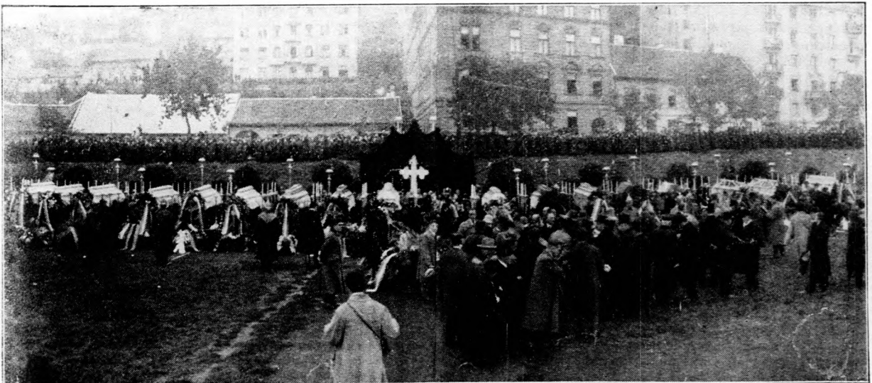
A biatorbágyi merénylet áldozatainak koporsói a Vérmezőn.

Lassu folyó a falu, de örvények rejtőznek benne. És az örvényekből a kisértők hangjai csábítgatva szólnak hozzá. Valami pánikszzerű, békányálás és mindent elközömbösítő: ugyis minden mindegy gondolkodás fekszi meg a falusi népet, amely azután lassan szétrombolja a férfias cselekvésnek és akarásnak a legkisebb megmozdulását is. A falu ma erőtlen. Széthullt, ellenállásra alig képes és dióhéjként összeroppan, ha valami bekövetkezik, mert a