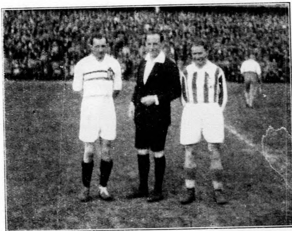
A magyar-cseh válogatott labdarúgócsapatok kapitánya és a bír.

A mérkőzésen a magyar csapat 3:0 arányú győzelmet aratott a csehek fölött.