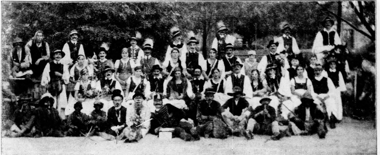
Kép a révfülöpi falusszövetségi fiók szeptember hó 20-án rendezett szüreti multságáról.

Aki valakinek pénzt ad, annak joga van a kölcsönpénzt vissza is kérni. Nem tagadjuk meg ezt az igazságot és nem is arra irányul kívánságunk, hogy minden emberi jog félretételével a hitelmorál megszüntetésére törekedjünk. Ahhoz azonban a hitelezőnek sem lehet joga, hogy felesleges költségek előidézésével észszerűtlenül tönkre tegye adósát. Különösen áll ez a magyar kisgazdatársadalomra, amelynek ezrei saját hibájukon kívül a katasztrófális áresések és termésviszonyok miatt kerültek olyan helyzetbe, hogy rövidlejáratu adósságaikat csak kisebb törlesztésekkel tudják visszafizetni. E kisgazdatársadalom érdekében emelünk szót és hívjuk fel a kormányt, hogy szükségrendeletekkel vessen gátat a falusi árveréseken elharapódzott vágyonpocsékolásnak. Két-