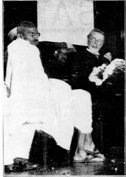
Gandhi, India szabadsághőse,

Bízzék a jövőben, a szerencse forgandóságában és vegyen egy osztálysorsjegyet. Mindenkit érhet szerencse! Miért ne Önt is! Nemcsak nálunk, hanem egész Európában alig van ember, akinek ne volna sorsjegye! A sorsjegyek ára: egész 24 P, fél 12 P, negyed 6 P, nyolcad 3 P az összes főárusítónál. A húzások már október 16-án kezdődnek.