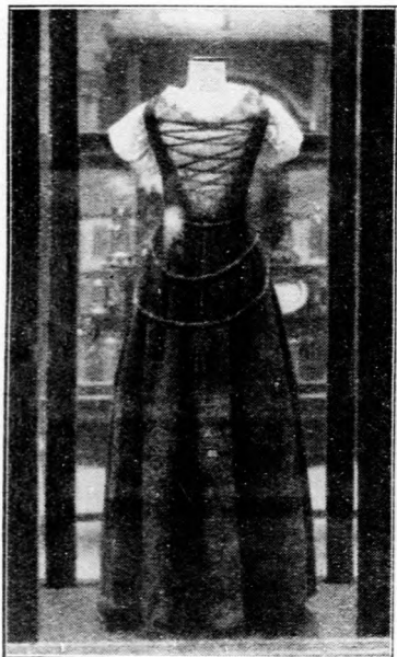
I. Rákóczi Ferenc nejének, Brandenburgi Katalinnak menyasszonyi ruhája,

A betegség okozója egy élősködő gomba, amelynek fonalai, a levél szöveteiben élve, barna foltok elkérgesedett