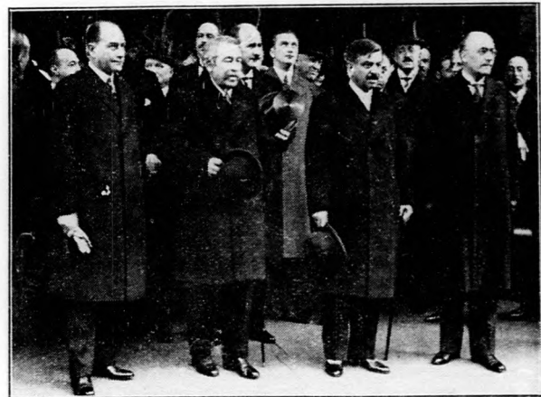
A német-francia kézfogas.