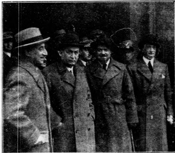
Balbo olasz légügyi miniszter Budapesten.

A rendelet szerint ezután évi 12 százaléknál magasabb kamatot nem lehet szedni. Ebben a 12 százaléknak minden egyeb, tehát a kamaton felül eddig felszámított forralmi jutalék, fojósítási jutalék, stb., is benne van. Nagyfotosságú az az intézkedés, mely szerint mindazok, akik már eddig sikertelenül kérték a teherrendező eljárást a Földteherrendező Országos Bizottságnál, kérhetik az árverés elhalasztását. De kérheti minden 100 holdon aluli birtokos is, akár fordult már a FOB-hoz, akár nem. Az ilyenirányú kérelmek előszóval, vagy írásban terjesztendők elő a bíróságnál, ügyvéd közbenjárása nélkül! A bíróság határozata megfellebbezhetetlen. További üdvös intézkedés az, hogy ezután az ingóságokat sem lehet