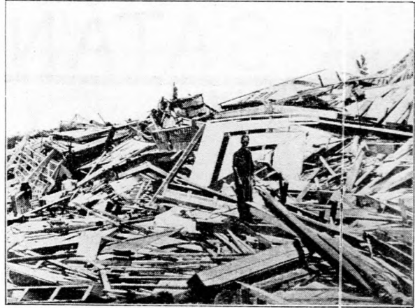
Kép a hondurasi orkánról.

gyümölcsészet, mezőgazdaság, állattenyésztés, szeszüzlet, mustbesűrítés, konzerv terén, 1932. január 1-én 27 évi praxissal rendelkező szakgyén állását óhajtaná változtatni. Cim a kiadóban megtehető.