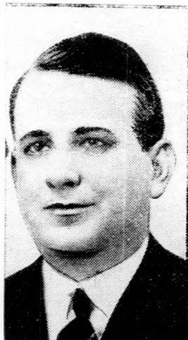
Matuska Szilveszter, a biatorbágyi rém.