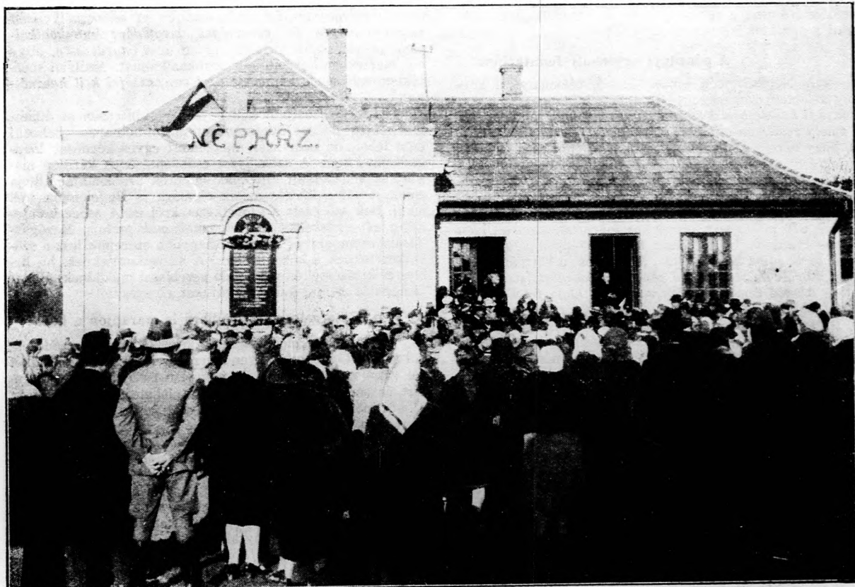
Népházavató ünnep és hősi emléktáblaleplezés Kerta községben.

A miniszterelnök először a népszövetségi jelentésben foglaltakra tért ki. A népszövetség tanácsa készségesen vállalkozott arra, hogy betekintsen pénzügyeinkbe és tanulmányozás után hozzászóljon azokhoz. Több oldalról kifogásolták, hogy a Népszövetség bizottsága rámutatott különböző okokra, amelyek a pénzügyi nehézségeket elő-