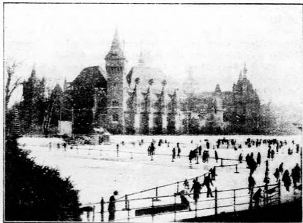
Koresolyázók a budapesti műjépgyályn, a Városligetben.

Walkó Lajos külügyminiszter szerint a magyar kormány tudott Bethlen István gróf erdélyi útjáról, de a kormány részéről nem volt semmiféle megbízatása.