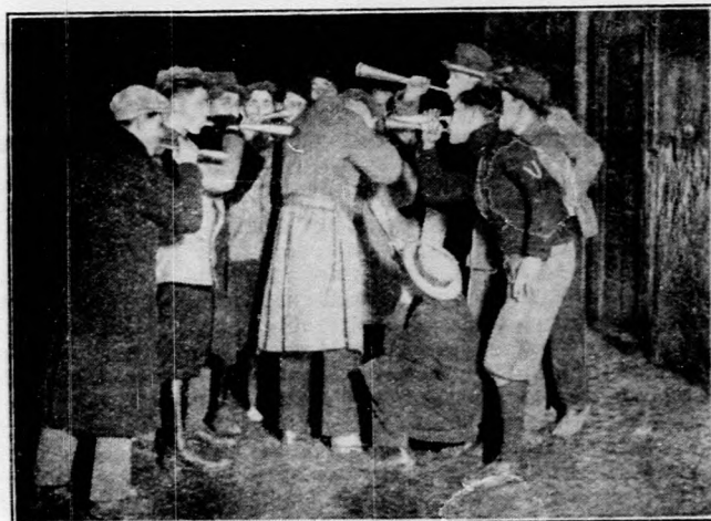
Különös népszokás Vizkereszt-napján.

Az ujjesztendő első napjain borzalmas hóvihár dühöngött még Kiskőrösön és környékén is. A fergeteges hóvihár félméteres hóval borította el a határt és teljesen elszigetelte a tanyákat a várostól. A hófúvások miatt a város és a tanyavilág között az összeköttetés napokon át szünetelt. A hideg miatt a hőeltakarítási munka csak nehezen haladt előre.