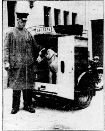
Mentőautó — állatoknak.