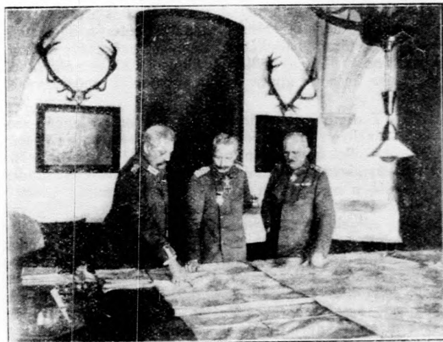
Hindenburg újra elnök lesz?