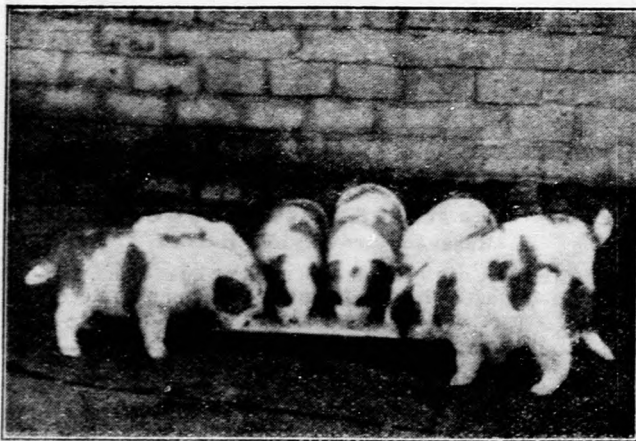
Háromhetes Bernáthy-i kutyák,

melyekből a havasok kitűnő életmentőit nevelik.