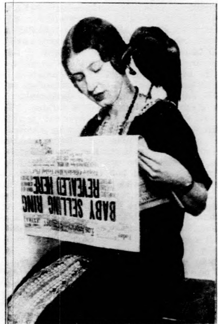
Varju mint — háziállat.

Az OMGE lótenyésztési bizottságának legutóbbi gyűlésén hozott határozatából kifolyólag küldöttség kereste fel Irády Béla földművelésügyi, majd Karafiáth Jenő dr. közoktatásügyi minisztert és előszóval is tolmácsolta a bizottság határozatait és kérését megábrangoló felterjesztések tartalmát. Irády Béla földművelésügyi miniszter a küldöttség előterjesztésére válaszolva kijelentette, hogy ismeri a lóértékesítés terén fennálló nehézségeket, ezeknek enyhítése érdekében egyrészt a honvédelmi minisztériummal, másrészt a külállamokkal folytatandó tárgyalások során mindent el fog követni és megfontolás tárgyává teszi, hogy a lóértékesítés és lókitétel előmozdítására még milyen intézkedéseket volna célszerű fogantatni . Karafiáth Jenő közoktatásügyi miniszternél a küldött-