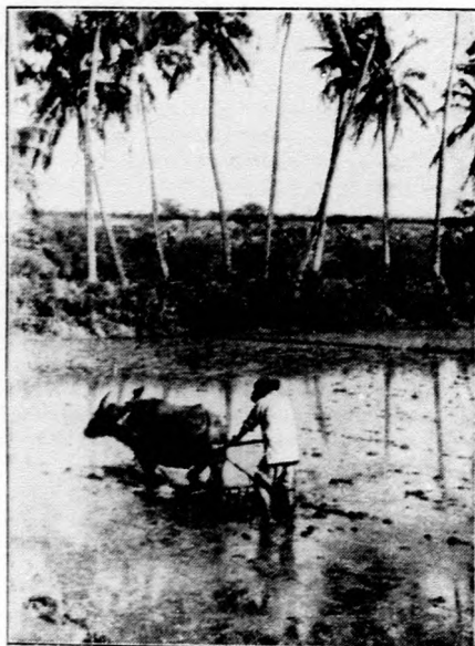
Rizsföld megművelése Haway-szigetén. A lovat a haway-i vízbőlény helyettesíti.