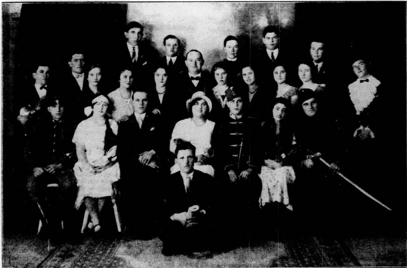
A szécsényi földműves ifjúsági egyesület műkedvelői a „Gyurkovics fiúk“ szerepeiben.

dani, hogy a viharfelhők Európa fölött megsokasodtak és a legnagyobb világpolitikai fordulat küszöbén állunk. Csalhatatlan jelek mutatják, hogy a német bomba úgy hatott, mint a derült égből lecsapó villám. És fejbe találta a francia közvéleményt, amely féktelen elvakultságában térdre akarta gazdaságilag is kényszeríteni a germán óriást; hogy legalább száz esztendőre megszabaduljon a „reváns“ szörnyű félelmétől. Párisnak régen nem volt ilyen kemény, meleg napja. Brüning asztalracsapása a versaillesi és trianoni „papír-rongyokat“ foszlányokká tépte, otthon pedig maga mellé sorakoztatta a német nemzetet, széttephetetlen egységben.