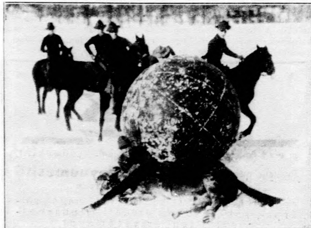
Az Amerikában honos lovas labda-játék egy komoly pillanata.

Kérdés: A „Vasárnap“ egy múlt évi közleményében azt olvastam, hogy miniszteri rendelet értelmében, azok az adófizetők akiknek az állami adója nem haladja meg a 11 P 60 fillért, azok a boletta-rendelettel kapcsolatban nem fizetnek adót. Életbelépett-e ez a rendelet? (Egy szegedi előfizető.) — Felelet: A földadó elengedésére vonatkozó rendelkezés most is élethen van, azonban az adóelengedést külön kérni kell, mert anélkül a pénzügyi hatóság azt nem törli. — A házadóra ez nem vonatkozik, a házadó után is kell pótdadót fizetni.