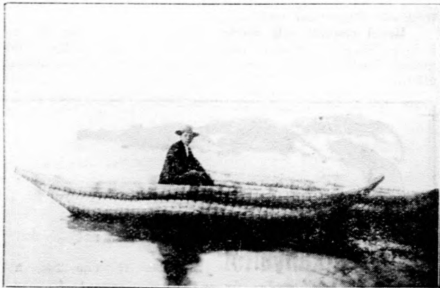
Kanoe, a délamerikaiak esónakja, melyet egy fatörzsből vájnak ki, vagy fakéregből állítanak össze.

A körzetenként egységesminőségű termelés előbbrevitele érdekében a földművelésügyi minisztérium növénytermelési hivatala a Dunántulra közép, soproni hosszú és kanizsai lapos, az Alföldre és az északi dombosvidékre pedig gyöngy babvetőmagvakat ad ki 5 métermázsánál nagyobb tételekben, részint természetbeni visszaadás, részint készpénzfizetés ellenében. E kiosztástól teljesen függetlenül a termelési körzetek legmegfelelőbb féleségének megállapítására a hivatal egy-egy igénylő gazdaság részére kisebb mennyiségben 5—6 különböző fajtajú és féleségű vetőmagot is ad ki fajtaösszehasonlító kísérletek