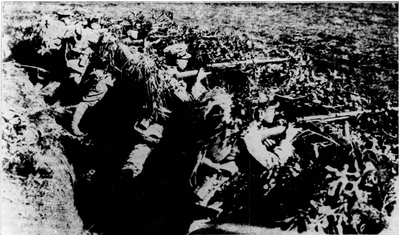
Kép a japán-kínai háborúból.

Még a kamatesökkentésnél is sürgősebb azon- ban, hogy a türehtetlen magas ipari, bolti árak lényeg- esen olcsóbbodjanak. Portékát és bolti árut majd- nem minden nap vesz az ember és hiába olcsóbbodik 1—2 százalékkal a kamat, ha az életet és gazdálko- dást az üzemi anyagok és ipari cikkek ára nem en- gedi olcsóbbodni. Németországban a kormány diktá- tort rendelt ki a létfenntartási költségek leszorítá- sára. Olaszországban Mussolini, amikor a tisztvisel- ők fizetését csökkentette, elrendelte, hogy minden-