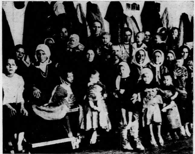
Kép a „borzalmak határa“ mellől.