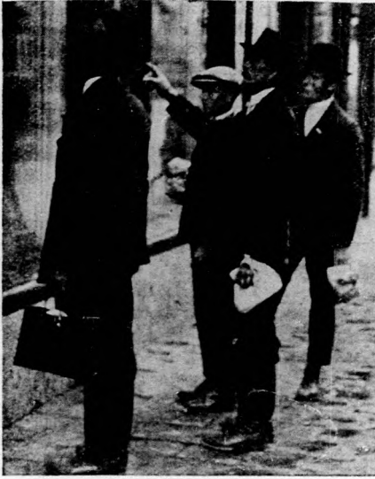
Falusi gazdák a fővárosi utcán.

és telepítéstől várja a mezőgazdaság sorsának jobbrafordulását. Marton Béla népművelési kormánybiztosság felállítását sürgeti, mert meg kell akadályozni a népbolondítók és látítók munkáját.