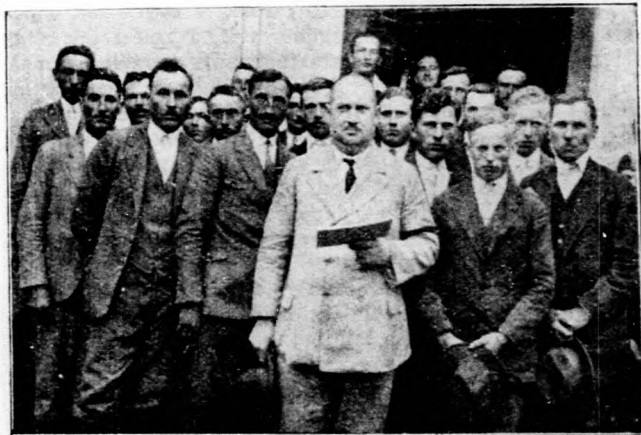
A litkei földmives daloskör.

A kereskedésekben, a piacokon a paprika zsákján, dobozán, fiókján rajta legyen a minőségnek megfelelő pontos és előírt név. Azonkívül a készlet kiárusításáig meg kell őrizni a minősítő jegyet. A paprika minősítését végző m. kir. szegedi és kalocsai vegyakisérleti állomáson minden minősített paprikátétel hivatalos mintáját másfél évig megőrzik. Így mód van az ellenőrzésre, az összehasonlításra.