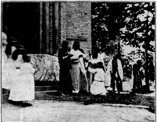
Péter-Pál-napi ünnepi játékok Máriaremetén.