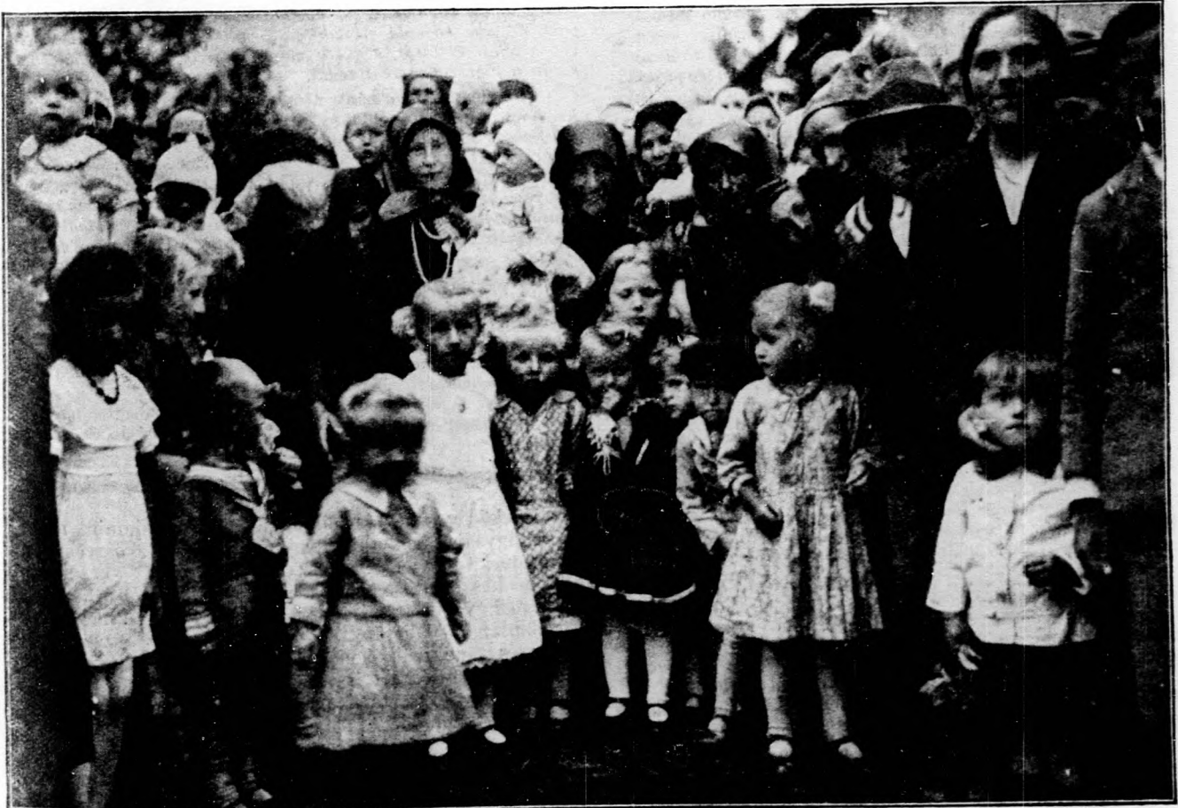
A litkei (Nógrád-megye) népművelési napon a gyermek gondozási versenyen megjelent anyák és gyermekeik.

Pesthy Pál ezután visszapillantást vetett az elmúlt politikai évre s hangsúlyozta, hogy a párt tagjai hűségesen kitarítottak a párt eszméi mellett, megőrizték a párt egységét és így biztosították a zavartalan kormányzást és lehetővé tették, hogy az ország a jobb jövő felé haladjon előre. Hangsúlyozta még, hogy a legközelebbi jövőben a földteherrendezés sürgős megoldása foglalkoztatja majd a pártot. Ezeknek a kérdéseknek a megtárgyalását a tizenhatos bizottság fogja végezni. A párt-