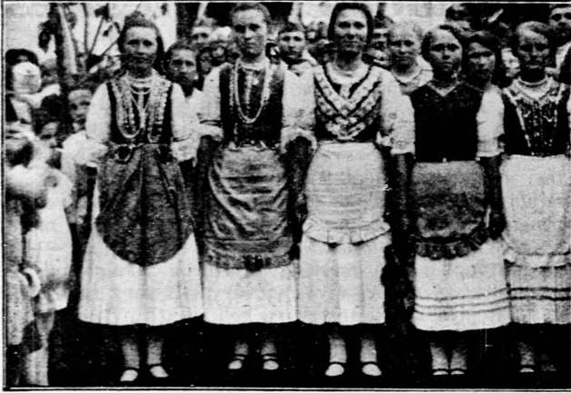
A litkei népművelési napon a szavalásban és szólóéneklésben kiténtetett tizenhat éven felüli leányok népviseletben.

széről elhelyezett betétek után lekötött betéteknél legfeljebb évi 6 százalékot, egyéb betéteknél legfeljebb évi 5¼ százalékot, lekötött betéteknél legfeljebb évi 5¼ százalékot szabad ezentul fizetni.