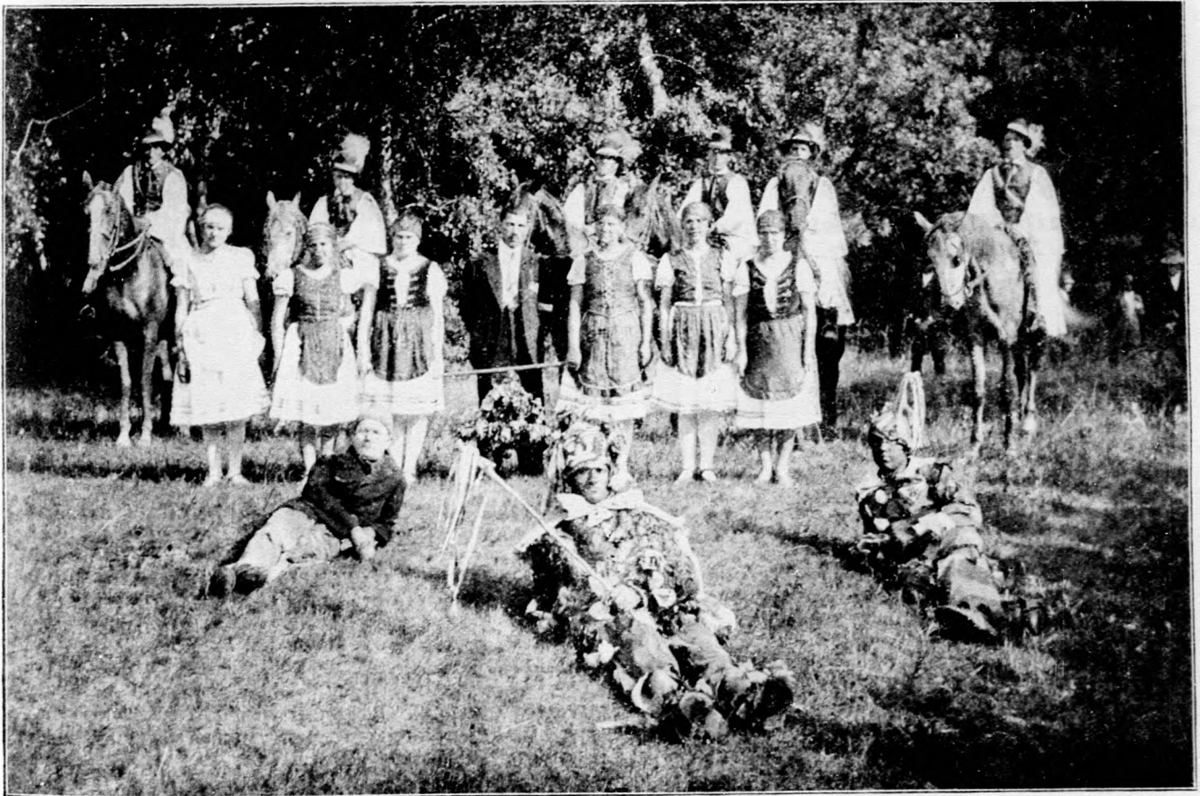
Kép a Tizsakürt-kórhányi Faluszövetség júniálisának egy csoportjáról.

állott kereskedelmi szerződést július hó 15-én tul ideiglenesen ismét meghosszabbítsák. Ennélfogva július hó 15-én a két állam között szerződésnélküli állapot állott be, azonban megszakítás nélkül folytatni fogják a tárgyalásokat az új kereskedelmi szerződés megkötése végett.