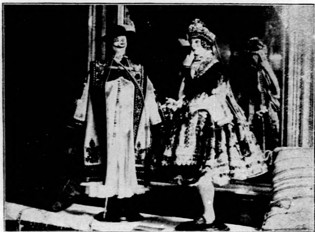
Sárközi viseletű babák,

Borsod—Gömör vármegyék közigazgatási bizottságának legutóbbi ülésén Wittner Kálmán gazdasági felügyelő beszámolt Borsod—Gömör vármegye mezőgazdasági helyzetéről. Rámutatott arra, hogy a vármegye területén a gabonarozsdakármegállapítás még júniusban megtörtént, azonban a kár azóta állandóan növekszik és a további csapások által okozott károk folytán ma már az 50 százalékot is meghaladja. A terméskilátások rozszabodása folytán a gazdák kötelezettségeiknek sem tehetnek eleget. Javasolja, hogy irjanak fel a kormánynak, tekintettel a rossz terméskilátásra, árveréseket ne tartsanak és felesleges költségeket ne okozzanak, ha a kiméleti idő, vagyis négy hónap alatt köztartozásaiknak nem tudnának eleget tenni.