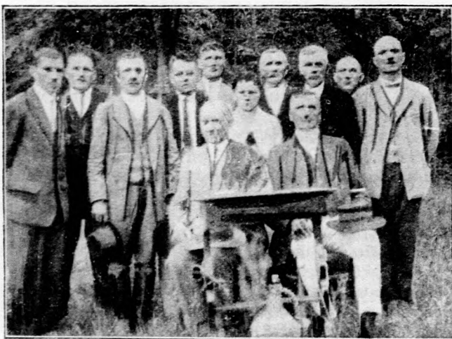
A Tiszakürt-kórhányi Faluszövetség vezetősége.

Végül a miniszter megállapította, hogy a multtal szemben ma eltérés mutatkozik. Mert amíg azelőtt minden