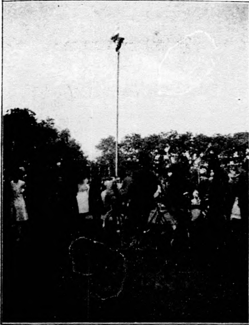
Pózmászás a Tiszakürt-kórhányi Faluszövetség júniálisán. A nyertes a pózna tetején elhelyezett ezüstórárt kapta meg jutalmul.