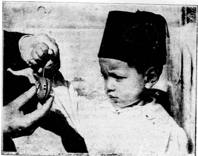
A marokkói szultán fia Párisban.

Az osztálysorsjáték szeptember hó 19-én megtartott zárulásán a 200.000 pengős főnyereményt a Belvárosi Váltóútlejt Rt. (Budapest, VI., Teréz-körút 37.) négy szerencsés vevője (vidéki kisgazdák) nyerte a 14925 számú sorsjeggyel.