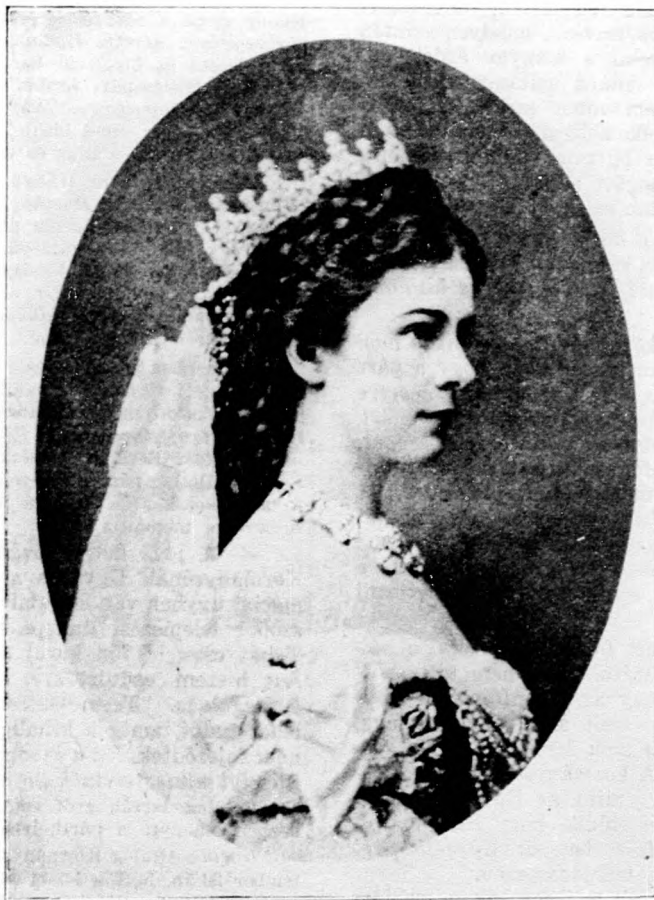
Erzsébet királyné, akinek emlékművét szeptember hó 25-én leplezték le Budapesten.

Az Egységspárt belső nyugtalanúsága az értekezlet óta sem pihent el és az egyes csoportok különböző kívánságokkal állottak elő, amelyek nem csupán a kormányintézkedésekre vonatkoztak, hanem a párt belső életére is. Mindezeknek a kívánságoknak a meg tárgyalása végett szeptember hó 22-re összehívták a párt elnöki tanácsát és úgy tudták, hogy az értekezleten a kormány tagjai is megjelennek. Közben történt azonban az a fordulat, hogy a szeptember hó 21-iki minisztertanács