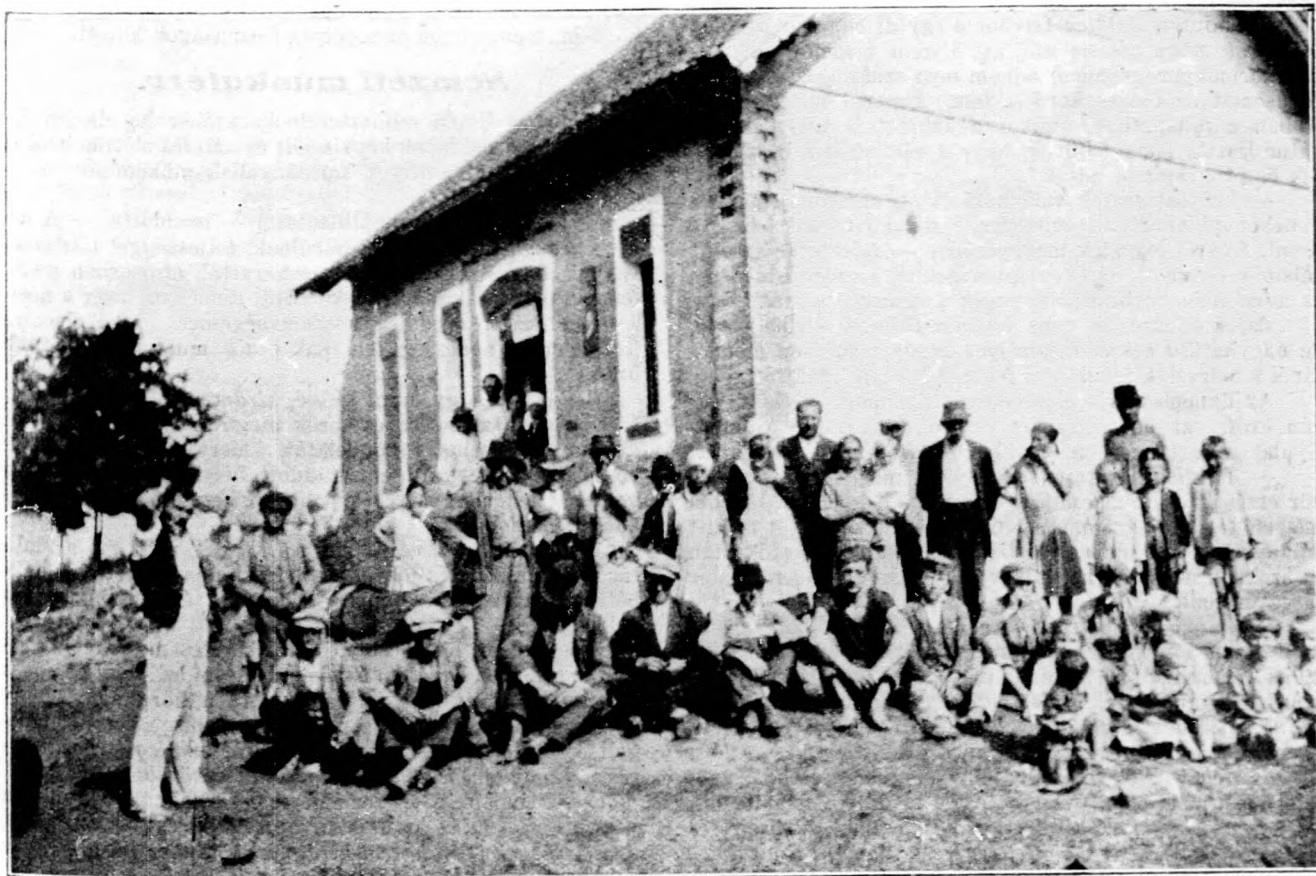
A felsőiregi telepesek egy csoportja a telep boltja előtt. (Lásd a cikket.)

Másnap, szeptember hó 29-én, esütörtökön a Kormányzó Ur, miután meghallgatta a politikusok nagy csoportját, még egyszer kihallgatáson fogadta Bethlen István grófot, az Egységspárt vezérét, és Károlyi Gyula gróf miniszterelnököt. Utánuk Gömbös Gyula honvédelmi miniszter jelent meg a Kormányzó Ur előtt. Kihallgatása után a következőket mondotta a reá várakozó újságíróknak: