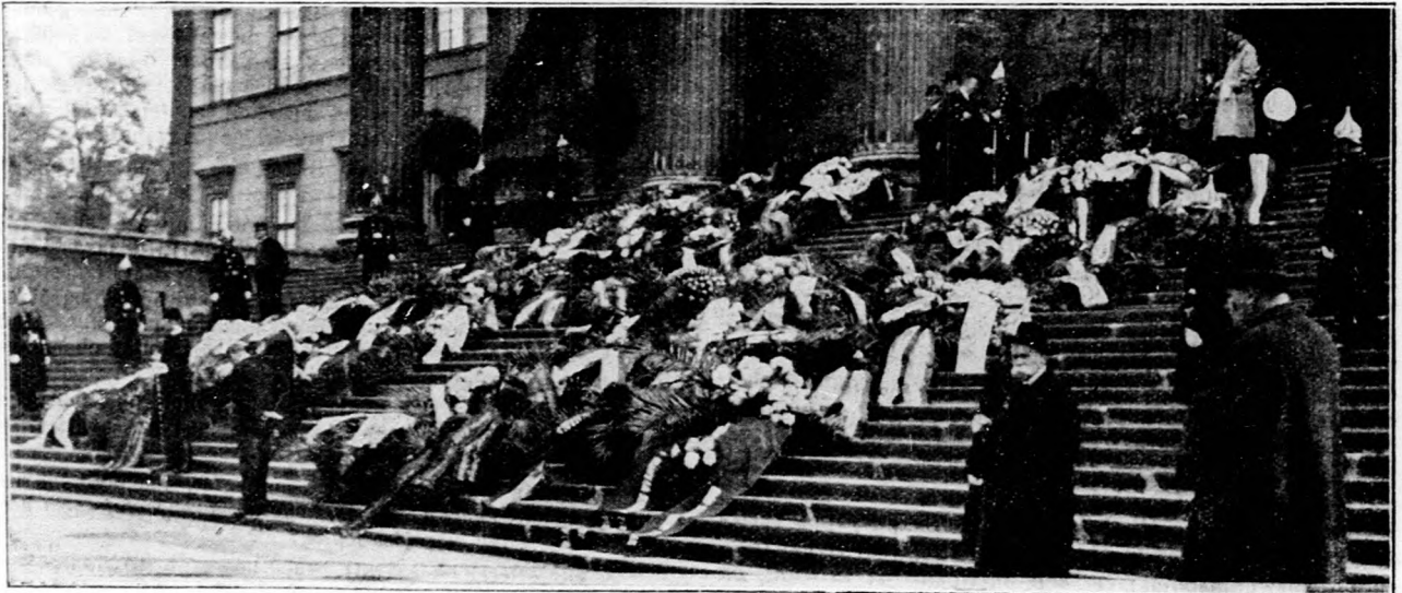
Koszoruerdő a Nemzeti Múzeum lépcsőin, Klebelsberg Kunó gróf temetésén.

— Ama kabinet tagjainak nevében mondok bucsuzót Klebelsberg Kunó grófhhoz , — mondotta — amelynek ő is tagja volt tíz éven keresztül, amelynek kebelében fejtegette ki áldásos munkáját, a magyar kultúra érdekében. A műhelytársak, bajtársak, a régi jó barátok bucsuznak nevében Tőled és nem emlékbeszédet mondunk, hanem eljöttünk, hogy még egyszer kezet fogjunk Teled, hogy még egyszer megragadjuk azt a kezet, amely annyit alkotott a magyar népért. És eljöttünk megmondani, hogy pátolhatatlan veszteség a Te távozásod a konstruktív magyarok táborában. Eljöttünk megmondani, hogy úgy érezzük, hogy nagyon kevesen vannak azok, akik építőmunkát folytatnak Magyarországra. Mert Te nem voltál szónokló, sokat beszélő és keveset markoló magyar hazafi. A Te életed nem volt tagadás, a Te életed pozitív érték, egy nagy plusz volt a nemzet életében. Te ennek a nemzetnek építőmunkása voltál. A háború után a magyar kultúra minden követ Te raktad le. Trianon után a magyar kultúrát Te mentetted meg az enyészettől, mert Trianonban nemcsak területi integritásunk veszett oda, hanem tisztulásnak indult az a fundamentum is, amelyen a magyar kultúra nyugodott.