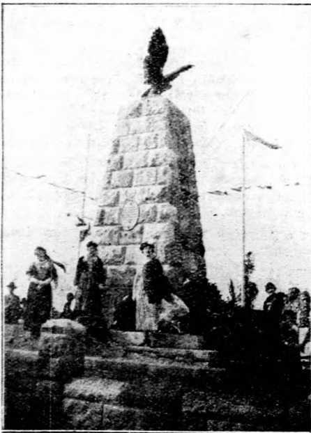
A romhányi Rákóczi-emlék.

— Ma elmúlt az ideje annak, — mondotta többek közt — hogy a kurucok és labancok nézőpontjából kiindulva, válaszfalakat emeljünk a magyarok közé. A független Magyarországnak csak egy táborban lehet a helye s a független Magyarországnak egy a kötelessége, kiművelni azt a nemzet öncéluság jegyében. Ne legyen se kuruc, se labanc, hanem legyen magyar testvér, aki összefog, megérti az idők szavát s velem együtt imádkozik a magyar sorsért.