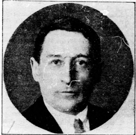
Klebelsberg Kunó gróf.