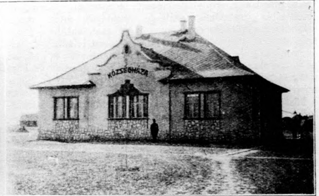
Képek az ujjászületett Csabacsüdről.