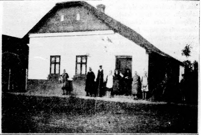
Képek az ujjászületett Csabacsüdről.

Balról: Egy kisgazda saját költségén épült háza. — Jobbról: Faksz-kölesönből épült ház.