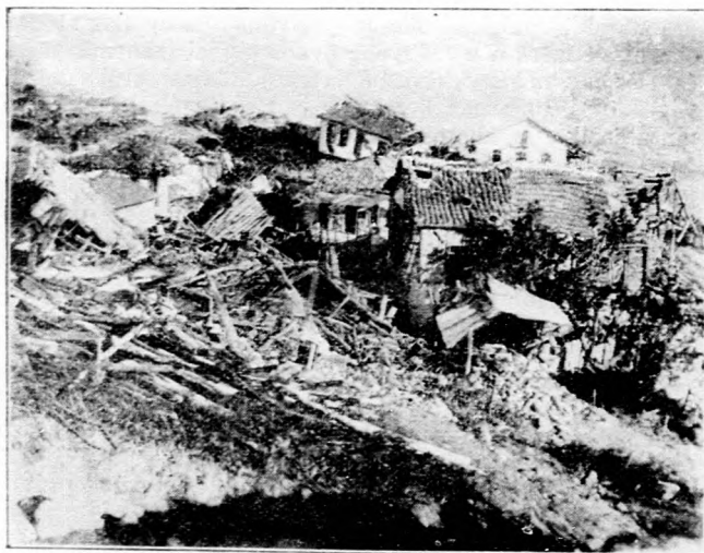
Kép a multkori görögországi földrengésről.