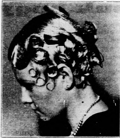
A legujabb női hajviselet,

A rettenetes drámát este tíz órakeresztül fedezte fel a munkából hazatérő család, aki halott gyermekei láttára idegrohamot kapott és egyre azt hangoztatta, hogy nem éri túl a katasztrófát, öngyilkos lesz. A rendőri bizottság kérésére Bálint a főkapitányságra ment és egyelőre ott tartották, nehogy kárt tegyen magában. A szerencsétlen áldozatokat óriási részvét mellett temették el.