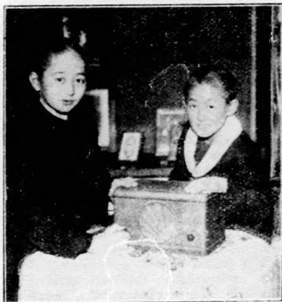
Két japán gyermek Tokióban, rádióhallgatja Genuában (Olaszország) előadást tartó édesapja beszédét.

— Mátyás királyról, az igazságosról, a hagyomány azt jegyzi föl, hogy legjobban kedvelte a somlói bort s akkor is táborában volt a somló, amikor Bécs városát ment megvívni. Akkor is sok ellenség és rendkívüli nehézségek vették körül a magyar nemzetet. Mátyás király bölcs kormányzása mégis naggyá és boldoggá tette az országot.