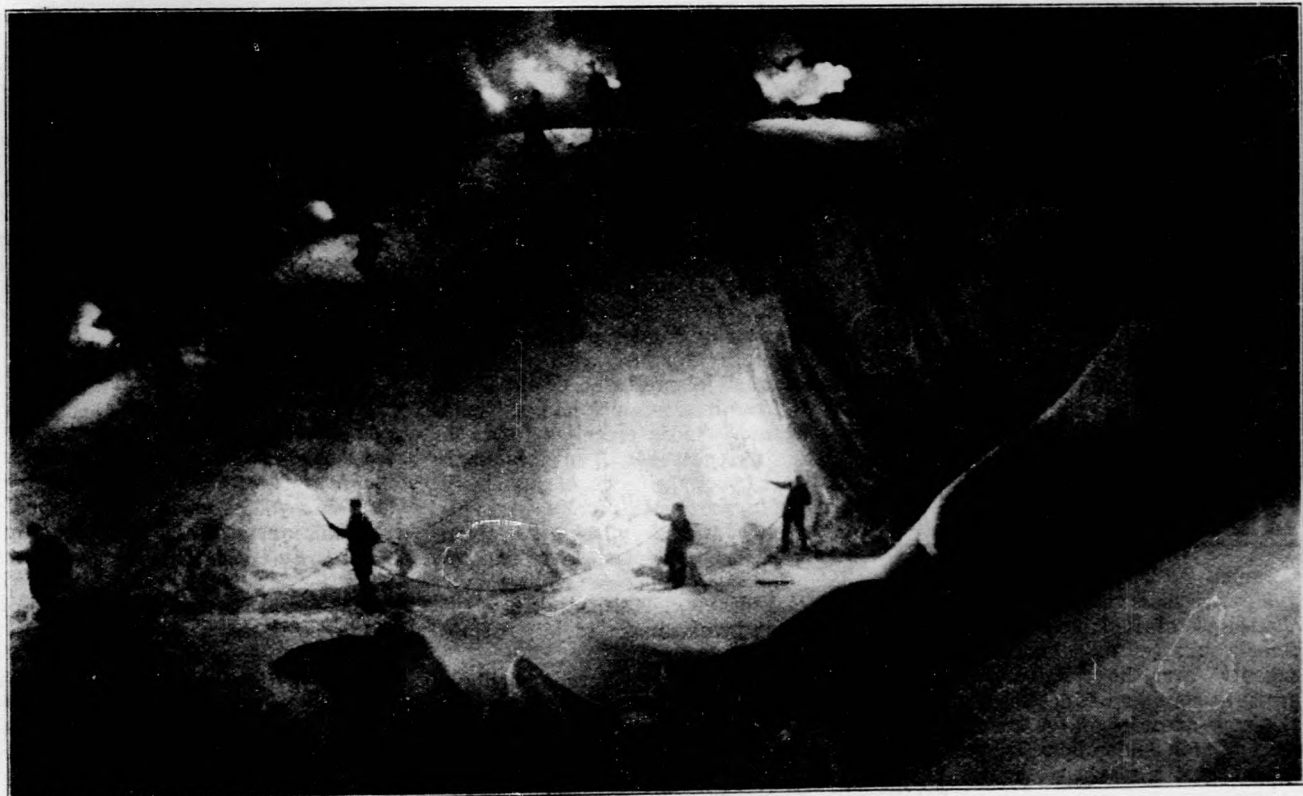
Küzdelem a „fehér halál” ellen

A Vasárnap Tanácsadójában ismételtelen közöltük azokat a feltéte-