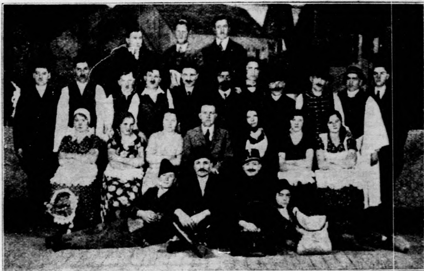
A csongrádi téli gazdasági iskola ifjusági gazdaköre

— A hazát csak a hazátlanságban lehet megtanulni igazán szeretni. Az emberben végtére is a jószándék és a jóakarát a fontos s én hazám ellen