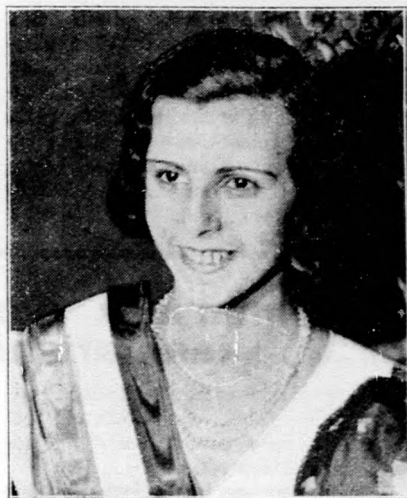
Az 1933. évi magyar szépségkirálynő.

A jugoszláv királyi pár bukaresti látogatását a békerevizíó kérdésével hozzák kapcsolatba. A két király tanácskozásán ugyanis vezetők politikusok és magasállású katonai személyek is részt vettek s így valószínű az a