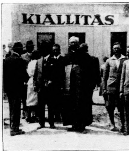
Kép a somlővásárhelyi kiállításról.

A pénzügyminiszter a legnagyobb eréllyel vette kezébe a gazdaadósságok kamathátralékának rendezését, mint a gazdaadósságok kérdésének jelenleg legégetőbb részét. Ebben az akcióban az elmúlt héten fontos lépés történt, még pedig a hosszulejáratu kölcsönök kamathátralékának ideiglenes rendezése tekintetében. A TÉBE (Takarékpénztárak és Bankok Egyesülete) azt ajánlja tagjainak, hogy kötvénykibocsátás alapjául szolgáló törlesztéses kölcsönöknél olyan adósok ellen, kiknek a törlesztéses kölcsönrel terhelt mezőgazdasági birtoka a kat. tiszta jövedelem 15-szörösét meghaladó mérvben van jelzálogilag megterhelve, netaláni hátralékok esetén is az 1935 június 30-ig terjedő időben a behajtási eljárást ne indítsák, illetőleg ne folytassák, ha az egyes törlesztőrészek lejártakor tartozásukra legalább oly összeget szolgáltatnak be a hitelező intézetnél, amely a mindenkor fennálló rendeletek értelmében az illetékes részlet esedékessége alkalmából az adós részéről szolgáltatandó.