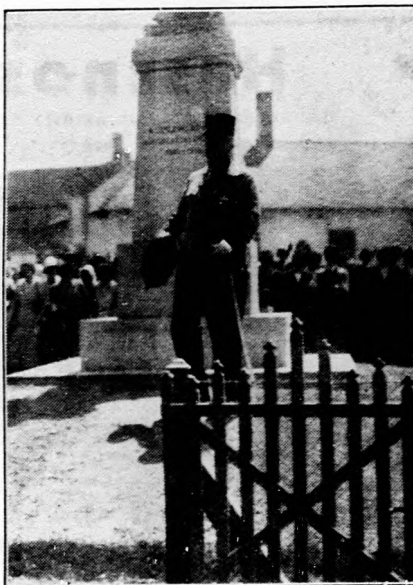
József királyi herceg megkoszorúzza a somlővásárhelyi hősök emléket.

— Ez az értekezlet — mondotta többek közt — felülmulja az előző értekezlet jelentőségét, mert az a célja, hogy megállapítsa a közép- és délkelet-európai államoknak a londoni világgazdasági értekezleten tanúsított magatartását. A varsói első értekezlet óta minden erőfeszítésünk arra irányult, hogy mezőgazdasági kivételünk számára elfogadható árakat biztosítsunk Európában, mert földmiveseink megélhetését és országunk helyzetét csak így lehet megjavítani. Ha ezt a célt elérnénk, kétségkívül nagymértékben emelkednék a mezőgazdasági államok iparcikkfogyasztó képessége és ez a mélypontra süllyedt ipari termelést is fokozná, enyhítené a munkanélküliséget, amely családtag-