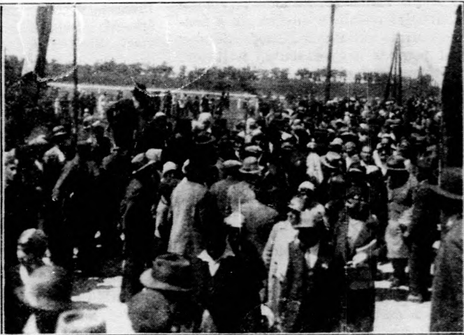
A Faluszövetség somlósárhelyi kiállítására érkező filléres gyors utasainak megérkezése. Balról: A gyors utasai és a rájuk várakozók a perronon. — Jobbról: Indulás a községbe.