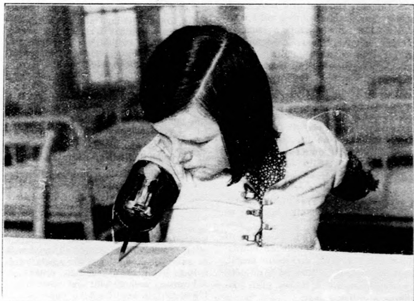
Az orvosi tudomány csodája

A bécsi ortopédiai kórházban van egy 13 éves kisleány, akinek mindkét karját amputálni kellett. Egy különleges szerkezetű fűző segítségével a kisleány már írni, enni stb. is megtanult.