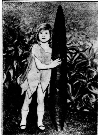
A világ legnagyobb szivarja.

A büntetés szigorú volt. Akit dohányzáson értek, annak a hóhér át-