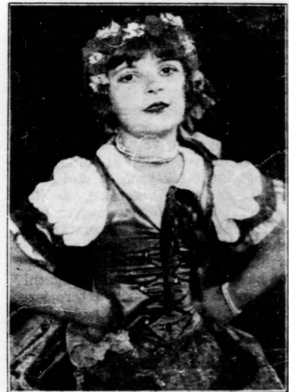
Ebből a kislányból tüzről pattant menyecske lesz.