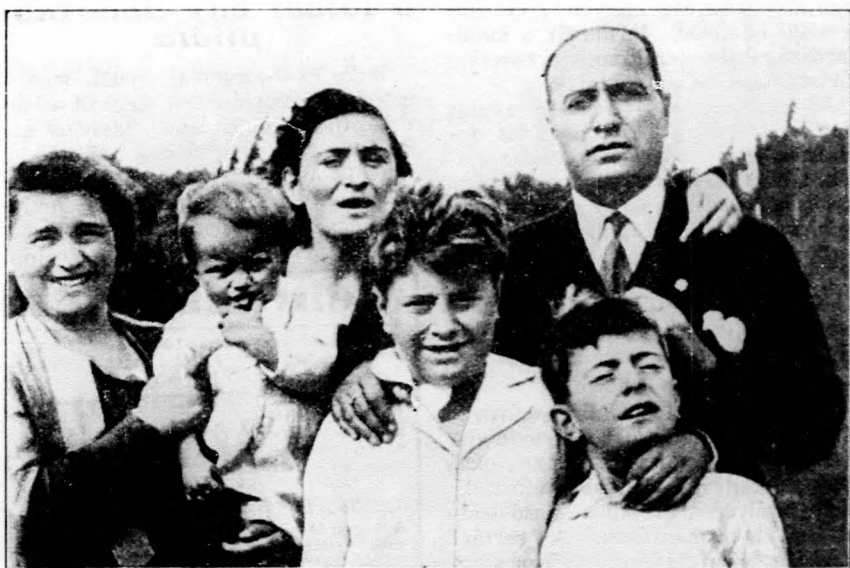
Az ötvenéves Mussolini családja körében.

A megszállott területen levő Medgyes közelében tovább ég változatlanul a hatalmas gázfáklya, amely naponta két és fél millió köbméter gázt pusztít el. A román mérnökök tudatlansága és hozzánemértése okozta ezt a szörnyű katasztrófát. Valóban fájdalmas nézni, hogy a magyaroktól elvett kincseket hogyan pazarolják el a románok. Ennek a katasztrófának az az oka, hogy az erdélyi származású komoly szakembereket kicserélték és tapasztalatlan, a földgázt nem ismerő bukaresti mérnököket vitték a medgyesi földgáztelepekhez. Minden eddigi kísérlet a tűz eloltására kudarcot vallott.