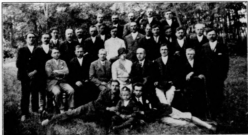
A Tiszakürt-Kórhányi Faluszövetség vezetősége és választmánya.

Benito Mussolini július hó 29-én 50 éves lesz. Minden magyarnak legfőbb imája és vágya, hogy az isteni gondviselés tartsa meg nemcsak az olaszok, hanem a mi számunkra is, mert mi elköteleztük magunkat nyiltan és férfiasan olasz testvéreinkkel úgy, ahogy azt a bátor nemzetek szokták.