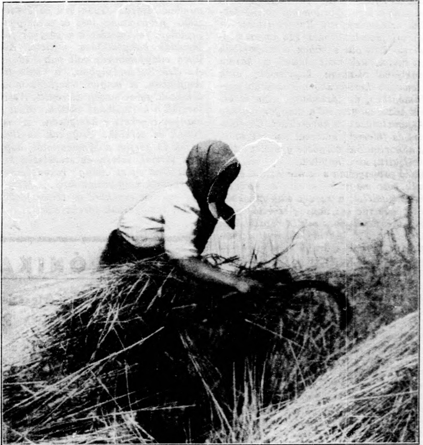
Itt az új élet!

hagymáról és cikóriáról volna szó. Az így termelt magvakat vámmentesen szállítják ki Némefországba. A jövőben a vámmentesség megmarad, de az export mennyiségét husz százalékkal megnövesztettük. A másik jelentős esemény a halkereskedelmet illeti.