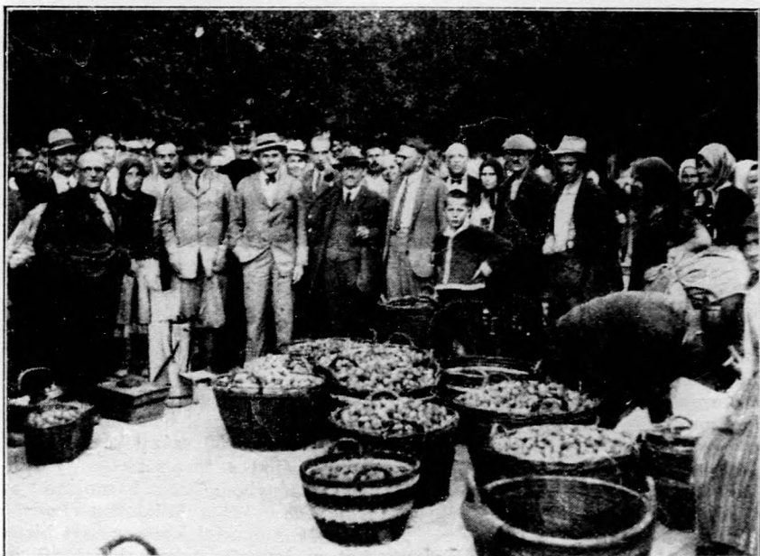
Kállay Miklós földmívelésügyi miniszter a kecskeméti hajnali barackvásáron

A Faluszövetség a nagyjelentőségű mozgalom támogatására sietve, a kanca- és csikódíjazásra arany- és ezüstérmét , továbbá diszokleveleket ajánlott fel.