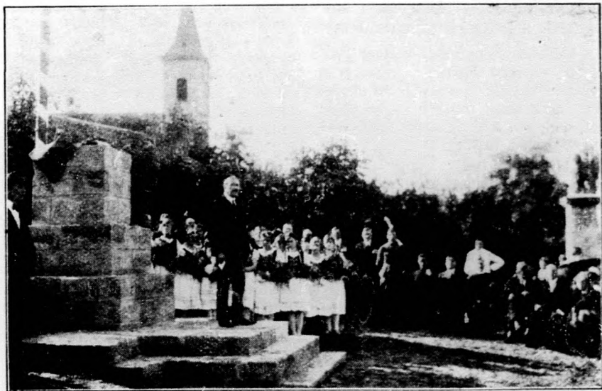
Országzászló-avatás a Veszprém-megyei Ajka községben

Stockinger Frigyes osztrák kereskedelmi miniszter és a kíséretében levő szakferfiak július hó 30-án érkeztek meg Budapestre külkereskedelmi tárgyalások végett. Az osztrák vendégeket a Keleti pályaudvaron Fabinyi Tihamér dr. kereskedelemügyi miniszter és magasrangú funkcionáriusok fogadták. Az érdemleges tárgyalásokat az osztrák-magyar vegyesbizottság még aznap megkezdte. Másnap folytatódtak a tárgyalások és Stockinger miniszter behatóan átbeszélte az anyagot Fabinyi és Kállay miniszterekkel. Az osztrák kormányfőiu budapesti tartózkodásának harmadik napján Gömbös Gyula miniszterelnökkel folytatott hosszabb tárgyalást, majd Fabinyi miniszter társaságában kiutazott Bányhidára, a villamoserő-telep megtekintésére. Az osztrák vendégek augusztus hó 2-án visszautaztak Bécsbe. A megkezdett tárgyalások folytatására rövidesen sor kerül Bécsben.