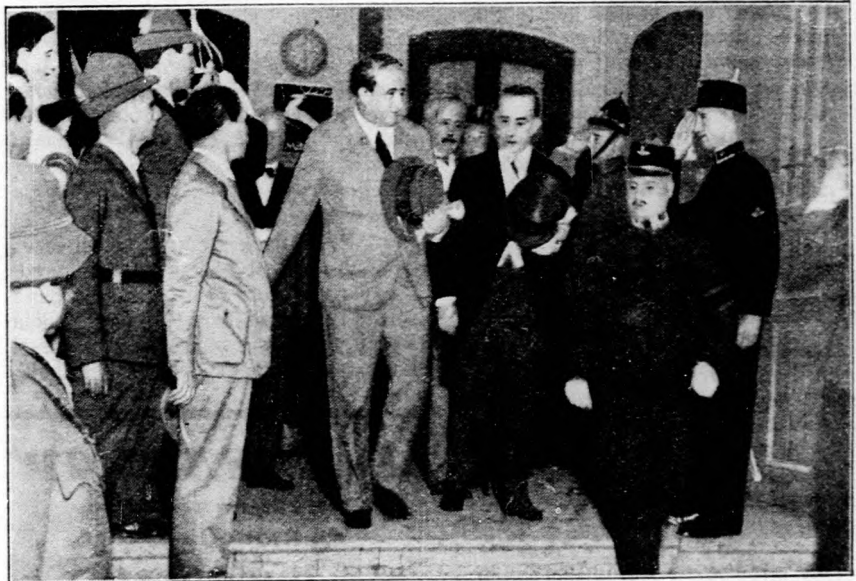
Gömbös Gyula miniszterelnök római utjáról megérkezik Budapestre, a déli pályaudvarra.

vízoriumot hozott létre a körülöttünk fekvő országokkal is. E tekintetben végzett munkánk hatása az idei termés értékesítése terén bizonyára érezhetően fog jelentkezni A kormány erőteljes, sikeres küzdelmet folytatott a költségvetési deficit megszüntetése érdekében s jelentős kamat- és adókedvezményeket léptettünk életbe; enyhítettük az adóbehajrási eljárást és figyelemreméltó kedvezményeket juttattunk a hadiözevgyeknek, árváknak, rokkantaknak, vitézségi érmeseknek és a többgyermekes családapáknak. Nagy lépéssel vittük előre a gazdaadósságok rendezésének ügyét , amely probléma végleges megoldása számára előkészítettük a talajt. Megállítottuk a gazdaárveréseket s a dollár értékében bekövetkezett eltolódás konzekvenciáját érvényesítettük az adósok igen sok és igen széles kategóriája számára. Az egyre sorvadó gazdasági élet nekilendítésére jelen-