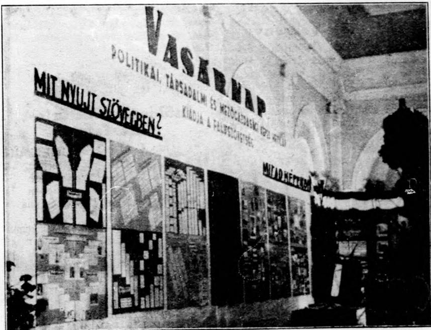
A „Vasárnap” csoportja a balatonfüredi kiállításon.

Szeptember hó 8-án, délután 4 óra- kor a gyógyépület földszinti termé- ben, szépszámú közönség előtt folyt