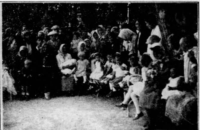
A Faluszövetség balatonfüredi gyermekszépségversenyén résztvevő gyermekcsereg.