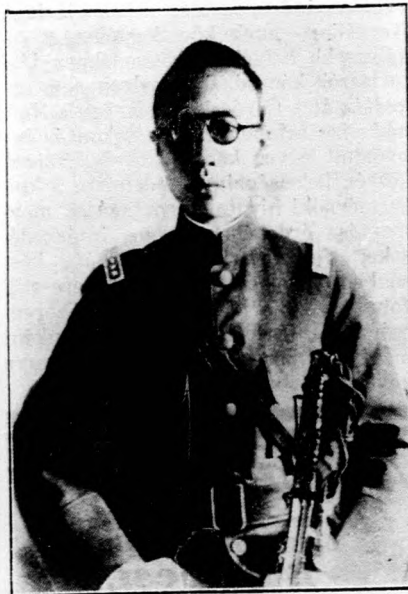
Pu-Yi, Mandzsuria új császára, aki március hó elsején foglalta el trónját

A borokat és eceteket házilag is lehet pasztörözni . E célból a bort vagy ecetet 10—15 literes palackba öntjük, az üveg száját tiszta gyapottal eldugaszoljuk, majd nagyobb fazékba állítjuk, melynek fenekére ruhát vagy szalmát tettünk és vizet öntünk az edénybe. A fazékban levő vizet aztán 50—60 fokra felmelegítjük.