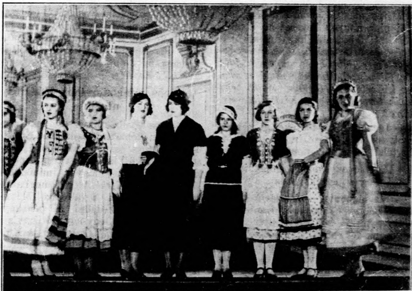
Kép a magyaros ruhatervek bemutatójáról

— Bizony én keveset jártam iskolá- ba — kezdte a szót. — Az én gyerek-