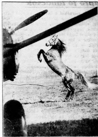
Az arab telivérnek nem tetszik a repülő gép.

Muscat Rothermere Lord. 1925-ben került először termőbe ez az új faj. Szeptember elején érik. Hatalmas,