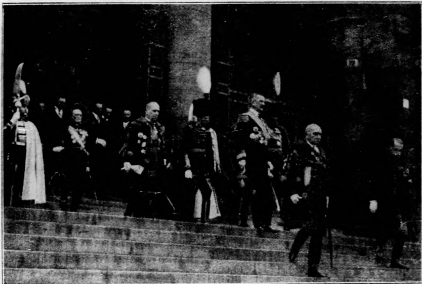
Horthy Miklós Kormányzó Ur

És ebben a szóban megtestesült a magyar föld multja és jövődjéje. Fájdalmi és örömei, dalai, végzete, hibája, szépsége, de benne van élni-akarása, a „csakazértis” és a magyar