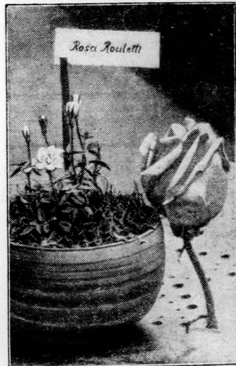
„Rosa Rouletti“, a világ legkisebb rózsája.

A borsó kuszó fajtáinak sorai közé dugdozzunk le ágas-bogas gallyakat, míg a futó-bab tövei mellé sima, hosszú karókat állítunk. A borsó-növény ugyanis kapaszkodik, addig a bab a karóra rácsavarodik.