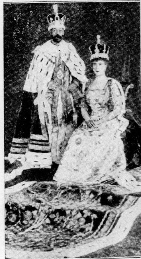
Az angol királyi pár jubileuma Képünk az angol királyi pár koronázása alkalmából készült, huszonöt évvel ezelőtt.

Filléres gyorsvonatok. Az államvasutak igazgatósága május hó 12-én, a következő filléres gyorsvonatokat indítja: Budapestről Pécsre. A menettérti jegy ára 5 pengő. — Budapestről Szombathelyre és Kőszegre. A menettérti jegy ára Kőszegre 5.50 pengő, Szombathelyre 5.30 pengő.