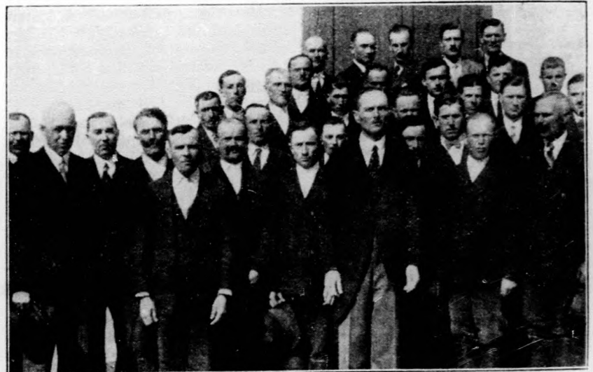
A nyírábrányi „Ábrányi Kornél énekkar“, amely megnyerte a Faluszövetség ezüstserleg-vándordíját.

A beérkezett levelekből örömmel látjuk, hogy a magyar fiuk dacára, hogy teljesen idegen környezetbe kerültek, beosztási helyükön feltalálják magukat és sikerül az egvébként zárkózott német gazdák bizalmát megnyerniök. Ennek az alkalmazkodási képességnek köszönhető, hogy az immár tízenkét év óta évenként megismétlődő csereakció révén Németországba utazó magyar gazdai fjakat szeretettel fogadják. Egyik-másik fiunak bizonyára szokatlan az új környezet, de a Faluszövetséghez érkező sorokból szinte kicsendül az a komoly elhatározás, amivel erre az utra készültek és minden egyes magyar fiu átérzi a németországi tartózkodás nagy fontosságát, hogy onnan — ha idejét okosan fogja felhasználni — milyen értékes tapaszt