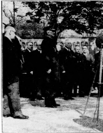
A Kormányzó Ur megnyitja a XXX. Budapesti Nemzetközi Vásárt.

A Károly-csapatkereszt és a sebesülési érem odaitélésének végső határideje. A honvédelmi miniszter a sebesülési érem és a Károly-csapatkereszt további odaitélését célzó kérések előterjesztésének végső határidejét 1935 december 31-én állapította meg. Az e határidő után beérkező ilyen kérvényeket már nem veszik figyelembe.