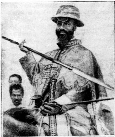
Egy abesszín hadvezér, az önkéntes csapatok parancsnoka.