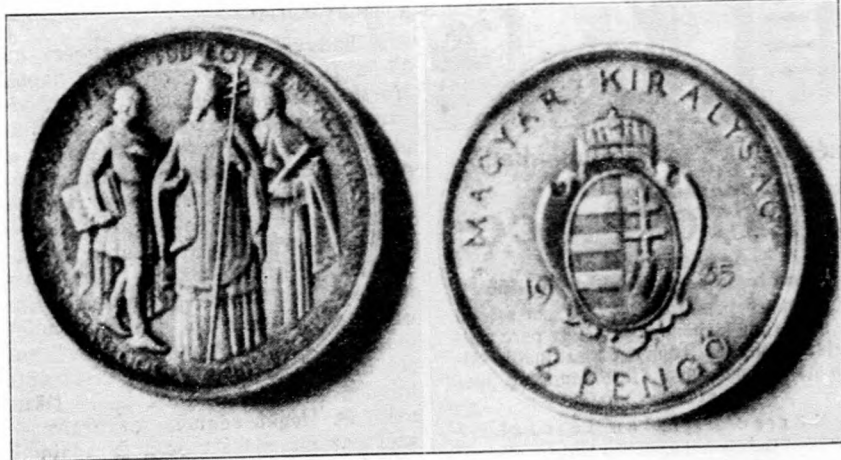
Az új Pázmány Péter-kétpengős, amelyet a budapesti tudományegyetem fennállásának 300 éves emlékére verettek.

A 80 oldalas könyv az Országos Magyar Gazdasági Egyesület (IX., Köztelek-utca 8. sz.) kiadásában jelent meg és ugyanott rendelhető meg. Ára 5 pengő.