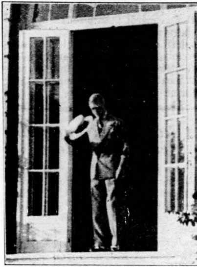
A walesi herceg Budapesten

Jó hangszerezen játszani a legnagyobb élvezet. Elsőrangú, igazán olcsón Reményi országos hírű hangszertelepén vásárolhat: Budapest, VI/15., Király-utca 58—60. Kérjen díjmentes 51. számú árjegyzéket, abból választhat.