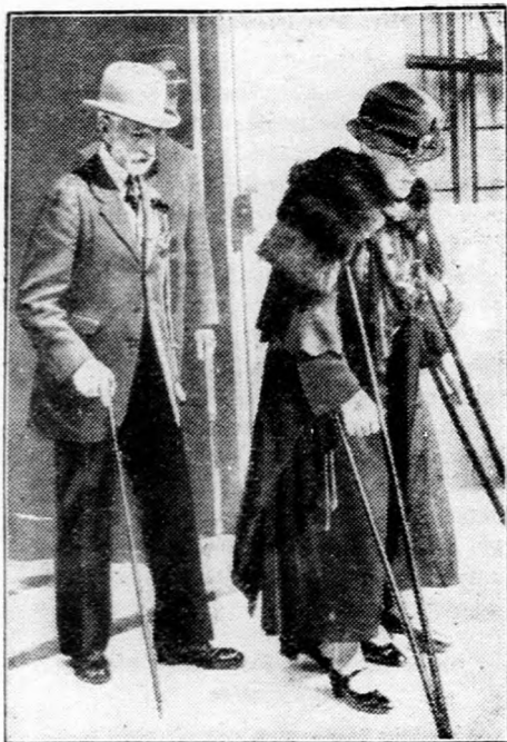
Egy 82 éves „ifju” pár

A 82 éves lord Montague of Brandon most vezette oltárhoz sógornőjét, a 81 éves Isabella Spring Reice-t. Az esküvő az angolországi Kensington városban folyt le.