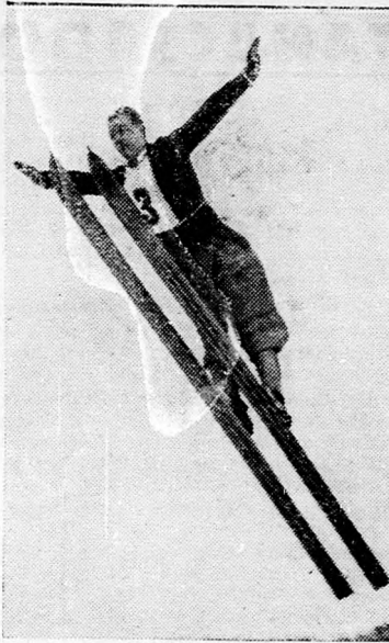
Nyolc nemzet fiai versengenek a téli olimpiáson,