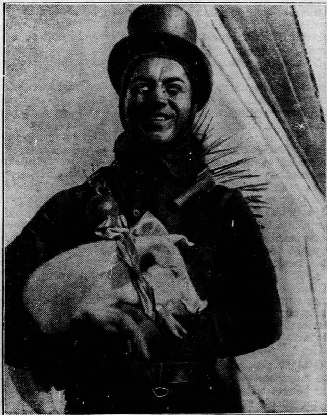
Boldogabb, szerencsésebb újévet!

termelés és értékesítés megjavításának a kérdései, a munkanélküliség kiküszöbölésére szolgáló javaslatok, a közegészségügy és közigazgatás a falusi nép érdekeinek megfelelő, helyes irányban való kiépítésének ügye. A velünk rokontörekvésű szervezetekkel karöltve alkalmat adtunk a mult év-