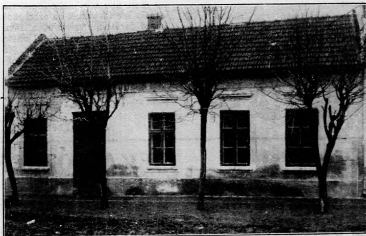
A Tótkomlói Kisbirtokos Szövetség székháza

Nincs helye a védettség visszaállításának, ha a gazdaadós jelzálogos tartozásai a volt védett birtok kataszteri tiszta jövedelmének kétszáz-