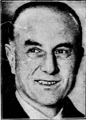
Aki mosolyogva elment . . .

Sir Samuel Hoare angol külügyminiszter, akit megbuktatott az abesszin-olasz háború.