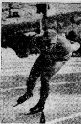
A norvég Ivar Ballgrund

Kis és Nagy találkoznak az utcán. — Kérlek, — mondja Kis — ha tudtam volna, hogy ilyen kellemetlen a házasság, nem nősültem volna meg. — Mikor nősültél? — kérdi Nagy. — Három nap előtt. — Na halod, mit tudsz akkor te erről én tudnék mesélni. — Miért? Te mikor nősültél meg? — Hat nappal azelőtt.