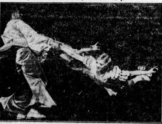
A keresekoroglyázás esodája.

A m. kir. honvédelmi miniszter a sebesülési érmet és a Károly-csapateresztet odaítélését célzó kérelmek előterjesztésének 1935 december 31-én megállapított eddigi határidejét 1936 június 30-ig meghosszabbította. Az érdekeltek kérelmüket a meghosszabbított határidő lejártá előtt anynyival is inkább terjesszék elő, mert a határidőt semmiesetre sem hosszabbítják meg újból.