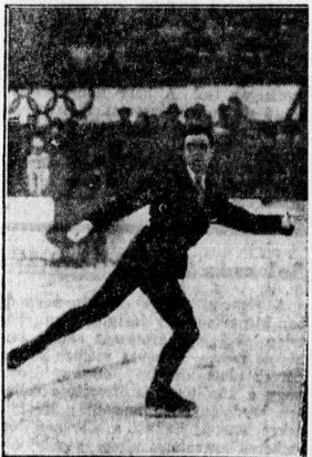
Az osztrák Karl Schäfer a világ legjobb műkorcsolyázója, aki a téli olimpián on természetesen első lett.