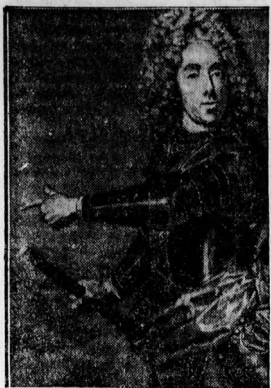
A törökverő hős halálának kétszáz éves évfordulója

Április 21-én volt kétszáz éve annak, hogy a francia származású Savoyai János herceg Belsőben meghalt, Savoyai Eugén herceg, a világhírhíresen egyik legnagyobb hadvezér, vett véget a törökök európai uralmának. Ő szabaddá tette Budát és a török világot.