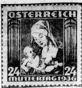
Az osztrák posta külön bélyeget adott ki az „anyák napjára“.

Közreadtuk a Vasárnap-ban a bodai szegénység ügyét azzal a gondolattal, hogy a nemzetvédelem első pontja: erősíteni a legyengült adóalanyt, keresetképesé tenni és elősegíteni, hogy munkakalkakhoz jusson. Azért írtuk meg, mert hisszük, hogy a debreceni MÁV, ha újra átvisszálja ezt az esetet, akkor nem ragaszkodik aholt betűhöz, amely az élet ellensége