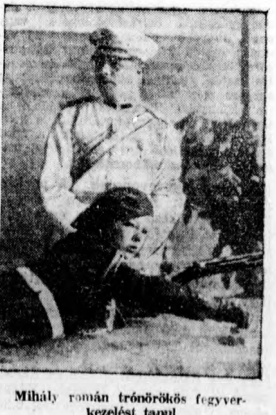
Mihály román trónörökös fegyverkezelést tanul