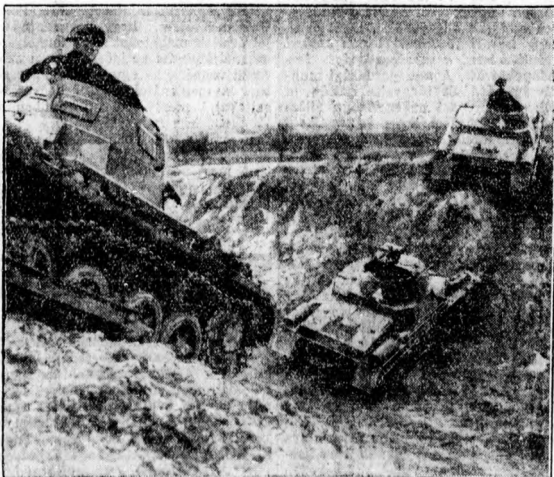
Német harckocsik — tankok — gyakorlaton