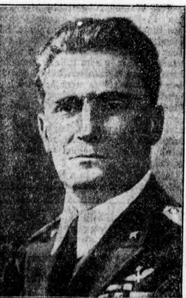
Grazdani tábornok. Abesszlnia új alkirálya, aki Badoglio tábornagy lemondása folytán került a meghódított területek élére

Marad a másik utolsó lehetőség: a családtagoknak és magának a munkaadó családtag-geptulajdonosnak is személyesiről való OGM rendkívüli tagként biztosítása a I P 44 f-re. Igen ám, csak hogy itt elől és a