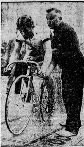
Merikens kerékpár olimpiai világbajnok (német).

Oda-vissza utazhatnak a főnökök, ha textilüzemekkel, az Állandó Maradek Szövetésé. Területiaktában (Budapest, Központi 32. csok az udvarban) szerző Dr. Olvassék el figyelemmel lapunk 3- adóján található híradást, amely a ná- pártalan ölességünki fogva, mindenkin- megfelel és tegyen egy próbarendelést, hogy fonyt egy pontos kiszámlálási és árúnak jöminőségéről meggyőződhesen.