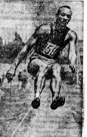
Owens, a háromszoros olimpiai bajnok. Ez a néger a világ leggyorsabb futója és legelső távolugrója.

Mint értesülünk, a levágot magyar marhák közül is válogatás történt, amennyiben megállapították, hogy melyek azok, amelyek a legkiválóbb húsukat Nirsels Pál, a sirci apátság előzőllási, továbbá a sárkadi, szerencsi és kaposvári cukorgyári uradalomk hízlat marhát találtak legkiválóbbnak. Hasonló verseny volt a sertésé is, de ennél az elszékkelt területen, Bánáiban és Bácskában hízlat állatok győztek.