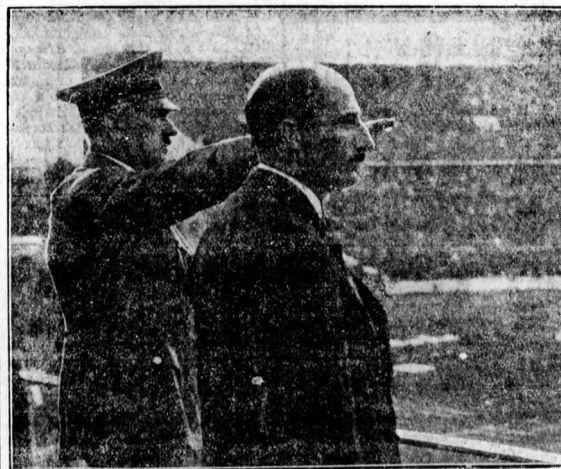
Boris bolgár király és Hitler az olimpiai stadionban

Egyenként is megemlékezett a miniszterelnök a magyar olimpiikonokról. Elismerő szavakat mondott azokról, akik sikert értek el és mentegelté azokat, akik különböző okok miatt nem tudtak bajnokságot szerezni.