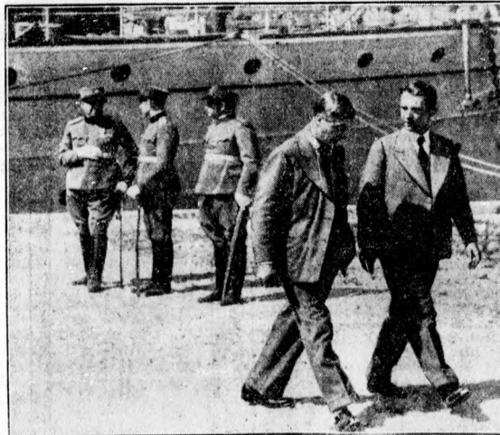
VIII. Eduárd angol király az Adriai tenger partján túli szabadságát Hátterében a világűrű jachtja.

Mármint az adósságok további rendezése szempontjából különböző a 10 holdon aluli és a 10—20 holdas védett birtokosok helyzete. A 10 holdon aluli védett birtokosok adóssága 50 évvel évi 4,5% kal törlesztendő hosszlejáratú kölcsönös alakul át. Kivételt képeznek a köztartozások és