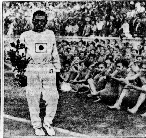
Son (Japán), a maratoni futás győztese

— Felelet: A szántóföldi szafesüstakarmányok termeléséről tájékozott szakkönyvek a következők: Konkoly-Thege Sándor: Szántóföldi takarmánytermelés, ára 2: