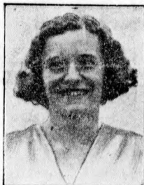
Csák Irbolya magyar olimpiai bajnok, a női magasugrás gőzele

A fogadtatás méltó volt a teljesítményükhöz.