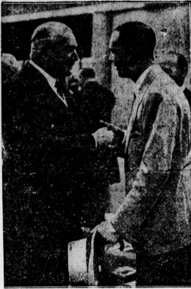
Umberto olasz trónörökös távozik az olimpiai szőről. Neurath birodalmi külügyminiszterrel bucszik a Tempelhoffi-repülőtéren.

Mezkeződtek a Körös hajóhátóvá fétélenek munkálatai. A földmívelésügyi minisztérium a Körös hajóhátóváte- lének munkálatait megindította. A múlt évszázadban megkezdte a Szentes alatti víz- erőszak építését, most pedig a földmívelés- ügyi minisztérium elrendelte a békés- szentandrási duzzasztógát megépítését, amely biztosítja lesz a korábbi hajózás- nak és a szentesi határ-öntözésnek is. A duzzasztó megépítése nagyszabású földmunkát jelent.