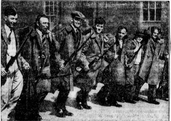
„Beöltöznek” az angol tartalékosok. Az angol fennhatóság alatt álló Palcsintinában a zavarások annyira elhajultak, hogy a kormány az anyországból egy új hadosztályt indított utának.

Szeptember 18-án tartotta közgyűlését a tiszai evangélikus egyházkerület a debreceni evangélikus templomban. Lichtenstein László országgyűlési képviselő megnagy beszédeben rámutatott a világszerte elharcapódó ateizmus (istentagadás) elleni küzdelem fontosságára. Továbbiakban a kormány kulturpolitikájáról beszélt Lichtenstein és helyeslele a kormány törekvéseit, mert — mint mondotta — a kormány kultúrpolitikáját az a nemes intenció vezette, hogy államomnyi iskolát egyesítse és hazafias nevelési szempontok hasznának át. Végl javaslatot tett, hogy hódoló táviratban köszöntsék a kormányt, és üdvözöljék a külföldön utuló miniszterelnököt.