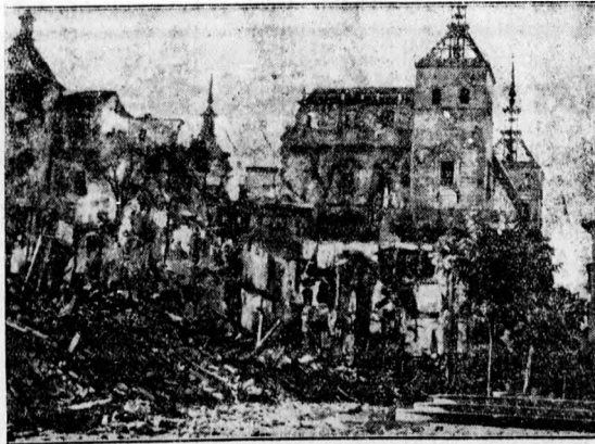
A tolelői „Ábacsar”.