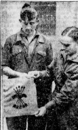
A spanyol ifjúság a vörösökt ellen. A nemzeti felkelők oldalán küzdenek az ifjú spanyol faszalsták is, akiknek jelvényük az összekötött nyíl.

A madridi város kormány kiltványt adott ki, amelyben fokozott ellenállásra hívja fel a lakosokat. A madridi kormány a polgárháború kitörése óta most először vallotta be nyiltan, hogy a főváros veszélyben forog.