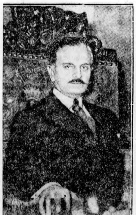
A népszövetségi közgyűlés új elnöke: M. Carlos Saavedra Lamos argentín külügyminiszter

A Hangya szövetkezeti központi igazgatósága szeptember 28-án tartott ülésén foglalkozott azzal a tennivalóval, amelyet Eber Antal, a Budapesti Kereskedelmi és Iparkamara elnöke székéből intézett a kamara egyik tagja, a Hangya szövetkezeti központ ellen. A kamara elnöki székéből, a megfelelő tájékozódás megszerzése nélkül, a Paprika-központtal, illetve a Hangya szövetkezeti központtal összefüggésben emondott dő a valószínűleg meg nem felelő állítást a Hangya igazgatósága a leghatározottabban visszautasította. A kamara elnöki székéből elhangzott és a kamara egyik illetékes támaszok folytán a Hangya Központ igazgatósága meg fogja tenni azokat a lépéseket, melyeket jogos érdekei védelmére szükségesnek tart.