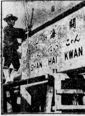
Japán ellenállhatatlanul nyomul előre. A kínai vasuti állomások feltrútnak már megjelentek a japán betörésük is.