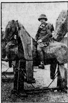
Falovon lovagol az utone