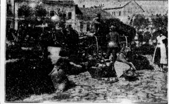
Paprikavásár Szegeden, a Tisza partján

Kéthetes borkezelői tanfolyam Az italmérő szakma érdekeitjeinek ké- relmére október 13-án Budafokon , az Állami Pincemesteri Szakszék ben kéthetes borkezelői tanfolyam kezdődik, amelyen résztvehetnek vendéglők, korsmá- rosok, valamint hozzártások és alkal- mazottak. A tanfolyamra a Magyar Szőlőudászok, Végelőkészítők és Korsmá- rosok Országos Szövetségé ndé lehet (Buda- pest, VI., Csengery-utca 51.) Jelenkezni.