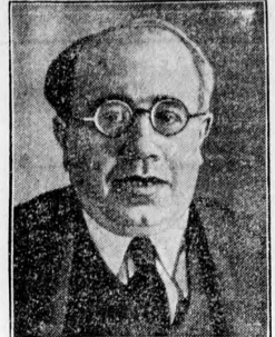
Az a, a spanyol köztársaság elnöke elmelekkelt helyéről és most egy hadhajón várja a további fejleményeket.