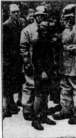
Bécsben a gyermekekkel és meguntárlt a gázalrak használataira

Fillessz vonatok. A Magyar Királyi Államvasutak Igazgatósága közli, hogy legalább ötszáz utas jelentkezése esetén ben október 11-én, vasárnap a következő fillessz vonatokat indítja: 1. Budapest-ról Sopronra, 2. Budapest-ról Szentesre (Kiskunfélegyháza át), 3. Budapest-ról Tokajra, 4. Ezerterepől Tokajra (Debrecenten át), 5. Debrecentenről Tokajra, 6. Ózdra és Miskolcra Tokajra, 7. Ceglédre Tokajra, 8. Sátorajai helyről Budapestre, 9. Nyiregyháza-ról Budapestre, 10. Szombathelyről Budapestre, 11. Szegebről Budapestre, 12. Pécsről Budapestre.