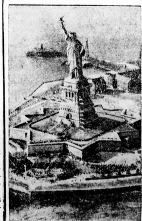
Ötvenéves Amerika szabadságszobra New-York kikötőjének behírtánusa