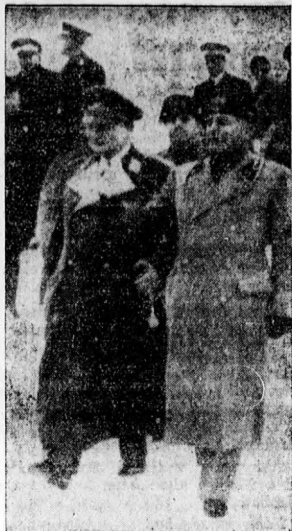
Göring német miniszterelnök látogatása Rómában

Magyarországon a szövetkezeti hálózat elérte a fejlődésnek azt a fokát, amely mellett a magyar gazdasági élet egyik fontos és lényeges tényezőjeként szerepel a közudatban. Arra kell tehát törekednünk, hogy a szövetkezés ügyét az élet felmerülő szükségleteihez képest továbbfejlessük, a nagy gazdasági érdekek szolgálatára mentől képesebbé tegyük és a nemzet javára hasznosítsuk. A szövetkezeti alakulás terén tekintélyes eredményeket állapíthatunk meg két irányban: az egyik a fogyasztási szövetkezetek működése,