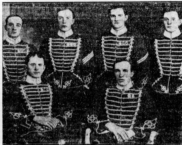
Hat testvér egy ezredben.

Egy svéd huszáregyemenben szolgáltak a hat déleleg Söpel-fü.